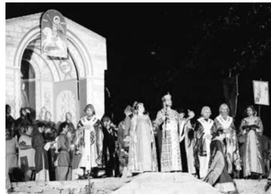
Велико Търново, 17 август 1987 г. Моменти от операта „Цар Калоян“ от Панчо Владигеров, представена в програмата на „Сцена на вековете“ на Царевец.

Във всички филми Караян е изпълнителен продуцент, дири-