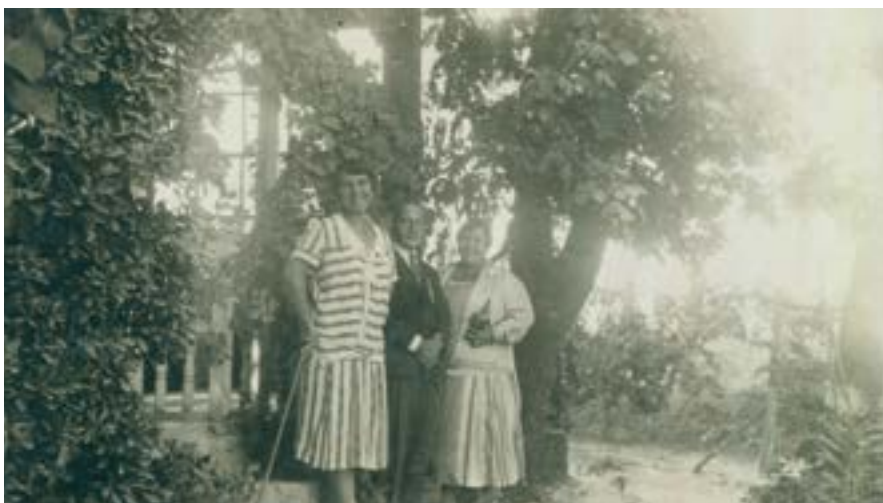
Панчо Владигеров с Христина Морфова и Людмила Прокопова през 1926 г.