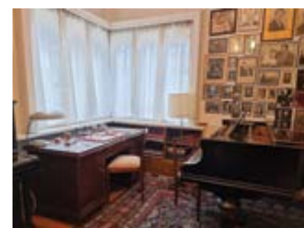
Кабинетът на Панчо Владигеров в къщата музей в София, която носи неговото име.