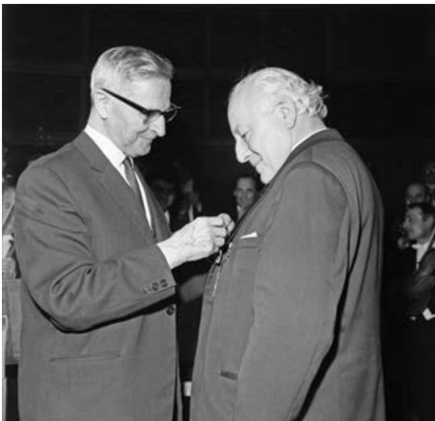
София, 12 март 1969 г. Заместник-председателят на Президиума на Народното събрание Георги Кулишев връчва орден „Георги Димитров“ на Панчо Владигеров.

На 19 февруари завършва подготовката за музикалните дни „Панчо Владигеров“, които се организират за първи път в Шумен – града, където е живял и отраснал един от най-бележитите представители на българската музикална школа, и посветени на 13-вековния юбилей на България. Уточнена е и окончателната програма.