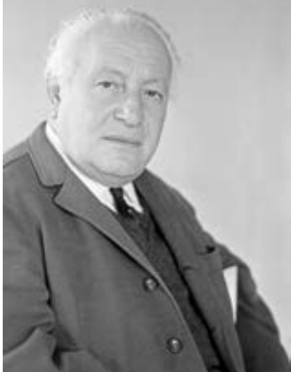
София, 11 юни 1978 г. Портрет на Панчо Владигеров.