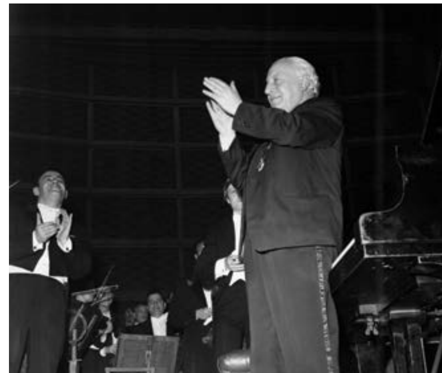
София, 12 март 1969 г. На честването по повод 70-годишнината на композитора, Панчо Владигеров е извикан на сцената от публиката.

На богатото музикално наследство на Панчо Владигеров е