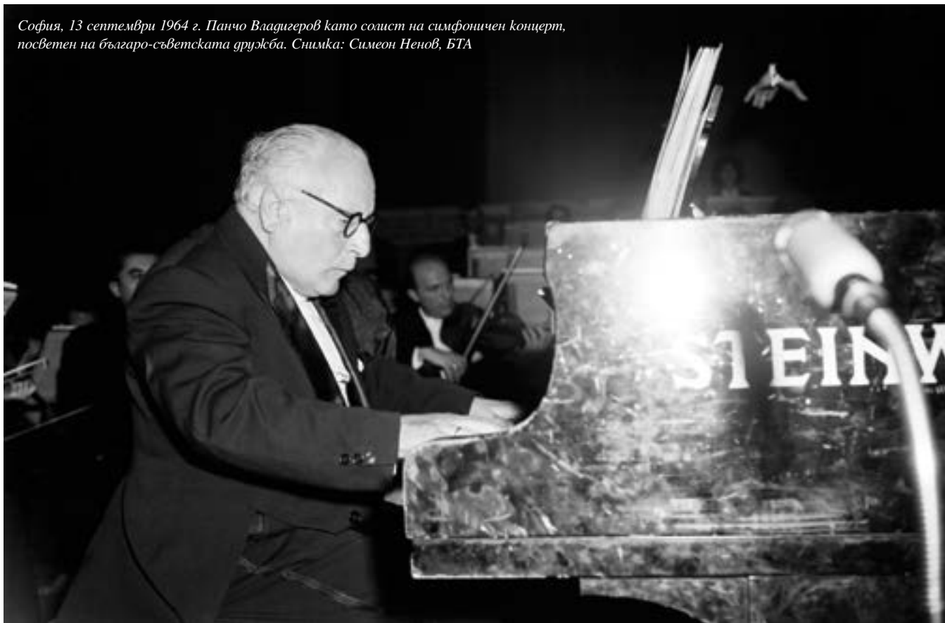
София, 13 септември 1964 г. Панчо Владигеров като солист на симфоничен концерт, посветен на българо-съветската дружба.

диума на народното събрание Георги Кулишев връчва на юбиляря орден „Георги Димитров“.