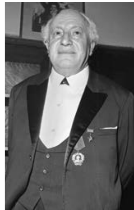
София, 12 март 1969 г. Панчо Владигеров на честването на своята 70-годишнина.

На почетна стража пред саркофага застават членът на Политбюро на ЦК на БКП Иван Михайлов, секретарят на ЦК на БКП Стоян Михайлов, заместник-председателят на Държавния съвет Георги Джагаров, ръководители на обществено-политически и масови организации,