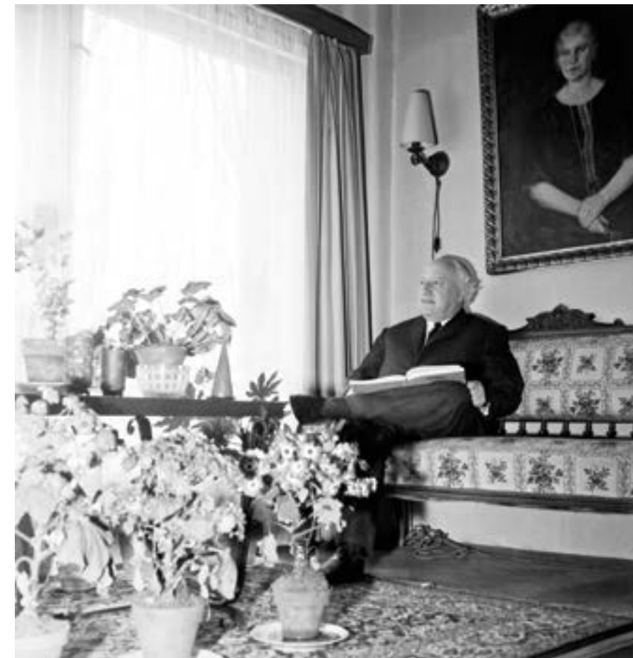
София, 7 март 1969 г. Панчо Владигеров в дома си.