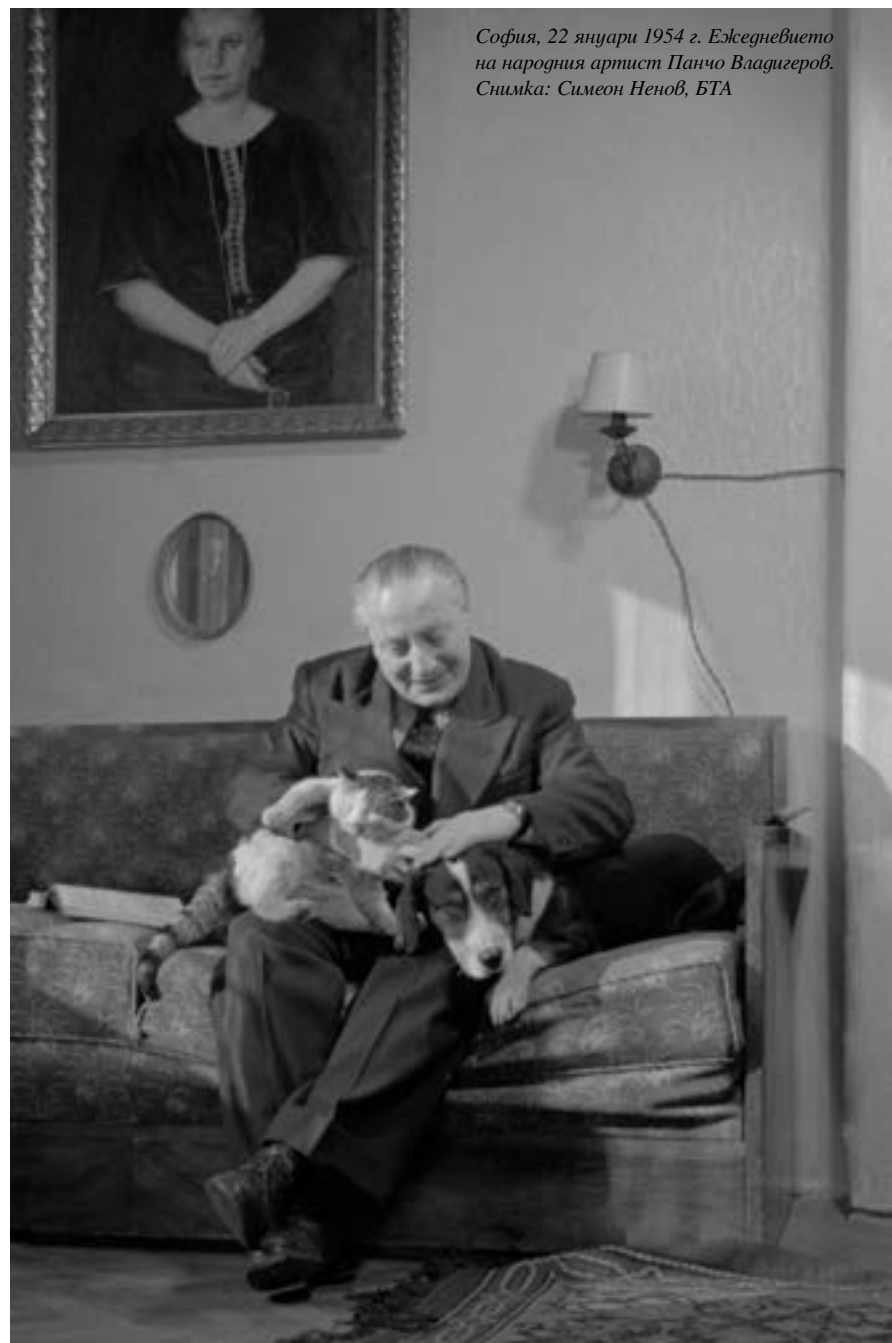
София, 22 януари 1954 г. Ежедневието на народния артист Панчо Владигеров.