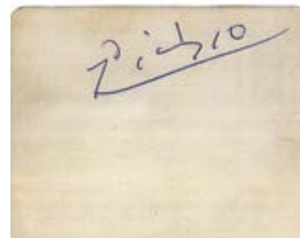
Делегатската карта на Панчо Владигеров от Световния конгрес на мира. На гърба е с автограф от Пабло Пикасо.

то му, съобщава БТА в началото на месеца.