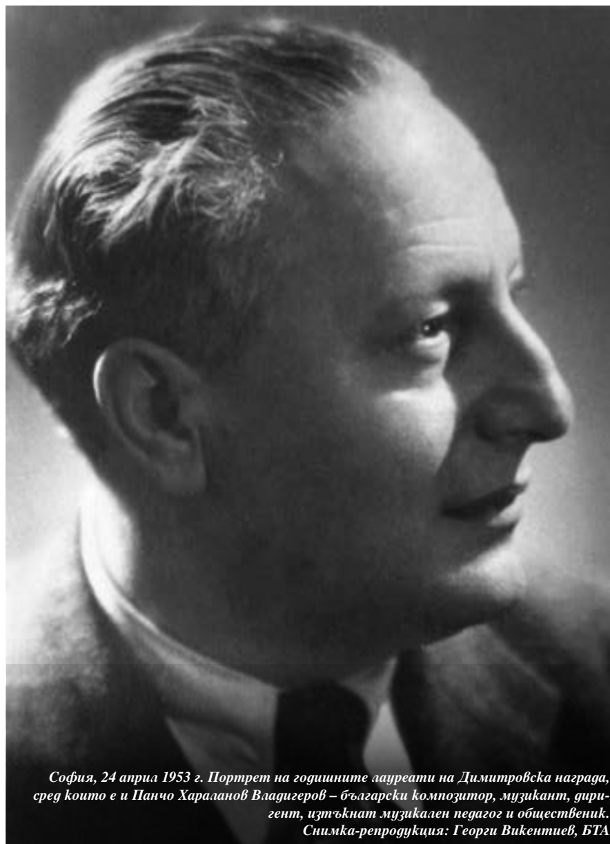
София, 24 април 1953 г. Портрет на годишните лауреати на Димитровска награда, сред които е и Панчо Хараланов Владигеров – български композитор, музикант, диригент, изтъкнат музикален педагог и общественик.

Майска симфония за струнен оркестър от Панчо Владигеров, Концерт за цигулка и оркестър от Веселин Стоянов и кантата „Девети септември“ от Филип Кутев по текст на Богомил Райнов.