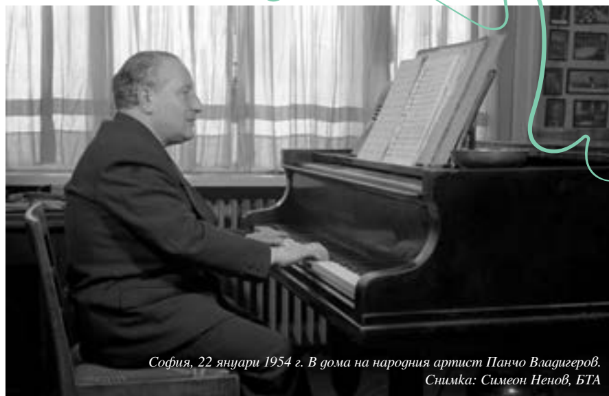
София, 22 януари 1954 г. В дома на народния артист Панчо Владигеров.