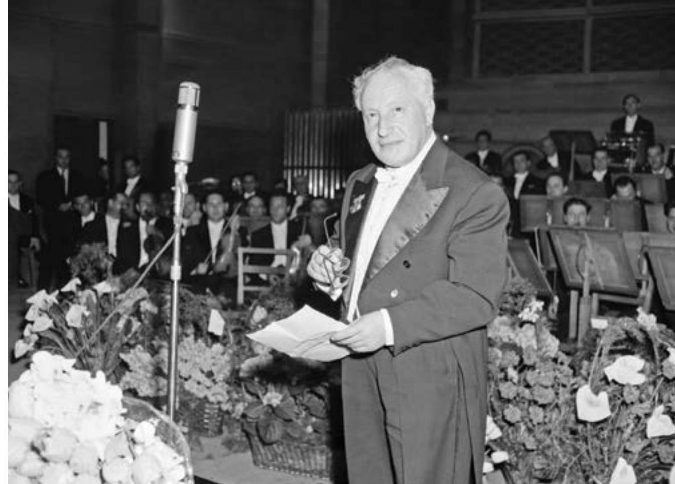
София, 9 април 1959 г. Честване на 60-годишнината на композитора в зала „България“.