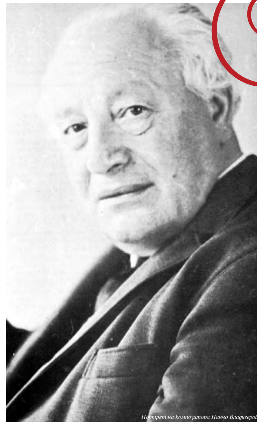
Портрет на композитора Панчо Владигеров