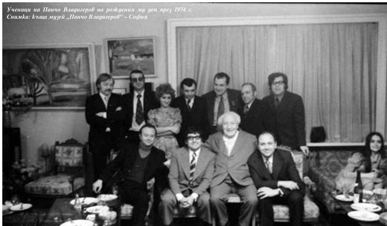
Ученици на Панчо Владигеров на рождения му ден през 1974 г.

Завършваме разговора с мисълта, че в къща музей „Панчо Владигеров“ – София винаги е имало и много музика, и много живот. Това се долавя все още в запазенения му кабинет, окичен с портрети на именити творци, с пианото му, застинало като че ли във вечно очакване някой да засвири отново на него, с писалището, на което са се родили някои от най-изтъняваните Владигерови творби и днес – десетилетия след създаването им.