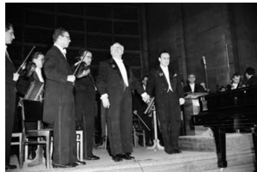
София, 9 април 1959 г. Честване на 60-годишнината на композитора Панчо Владигеров в зала „България“. Софийската държавна филхармония изнася концерт с негови творби.

За творческия път на Панчо Владигеров кратко слово произнася композиторът Александър Райчев. „Значението на този голям български творец – заявява той, – непрекъснато расте. Панчо Владигеров не само създаде класически образци във всички музикални жанрове, но и сега в светлото социалистическо настояще вече четвърт век осъществява успешен пробив в общите ни усилия за създаване на дълбоко национално и социалистическо по своето същество творчество.“