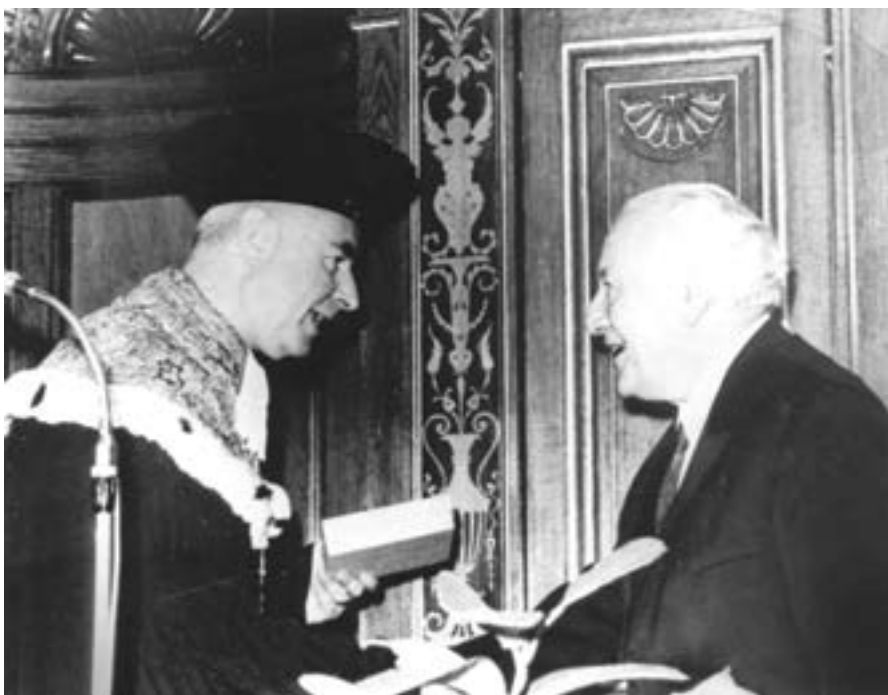
Панчо Владигеров при получаването на Хердцова награда през 1968 г.

ще бъдат почерпени с истинско японско суши, приготвено от г-жа Фукуи. Проявата е в рамките на Дните на японската култура в България.