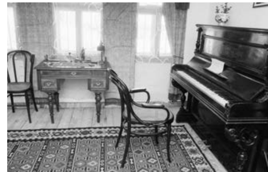
Шумен, 17 февруари 1986 г. Част от сбирката на музея, носещ името на Панчо Владигеров.

първа опера „Цар Калоян“, чиято премиера в София ще бъде на 25 март“, съобщава сам композитора и добавя, че се разделя с добруджанци „оттук с мъка“.