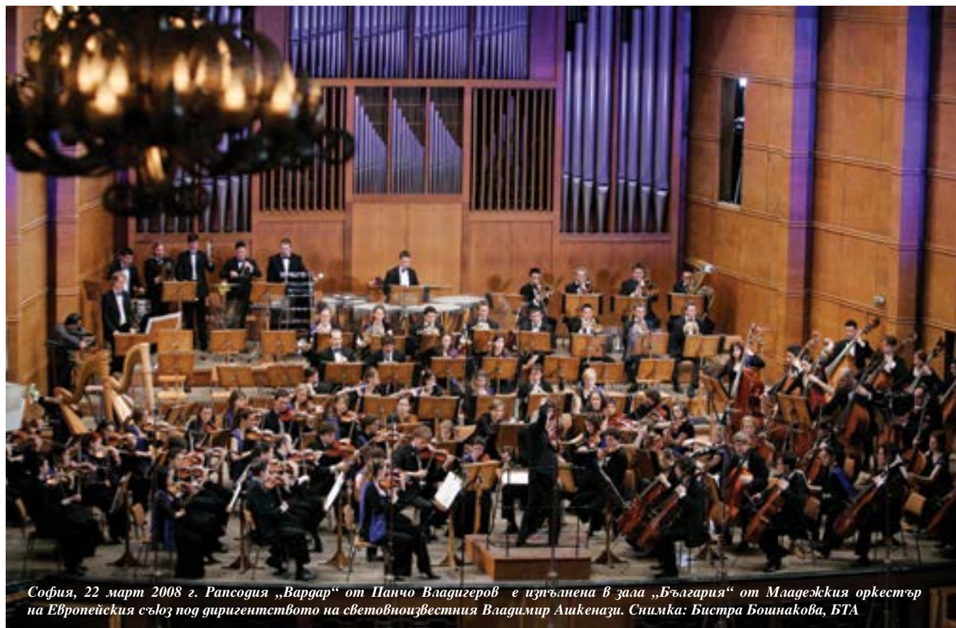
София, 22 март 2008 г. Рапсодия „Вардар“ от Панчо Владигеров е изпълнена в зала „България“ от Младежкия оркестър на Европейския съюз под диригентството на световноизвестния Владимир Ашкенази.