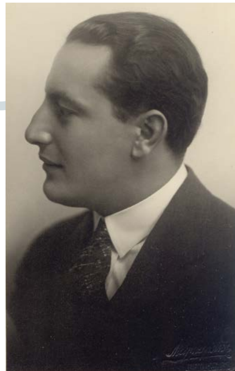
Портрет на Панчо Владигеров от 1926 г. Снимка: къща-музей „Панчо Владигеров“

се включат и в детско колективно музициране със звукоподражателни и ударни инструменти с Даниела Желязкова.