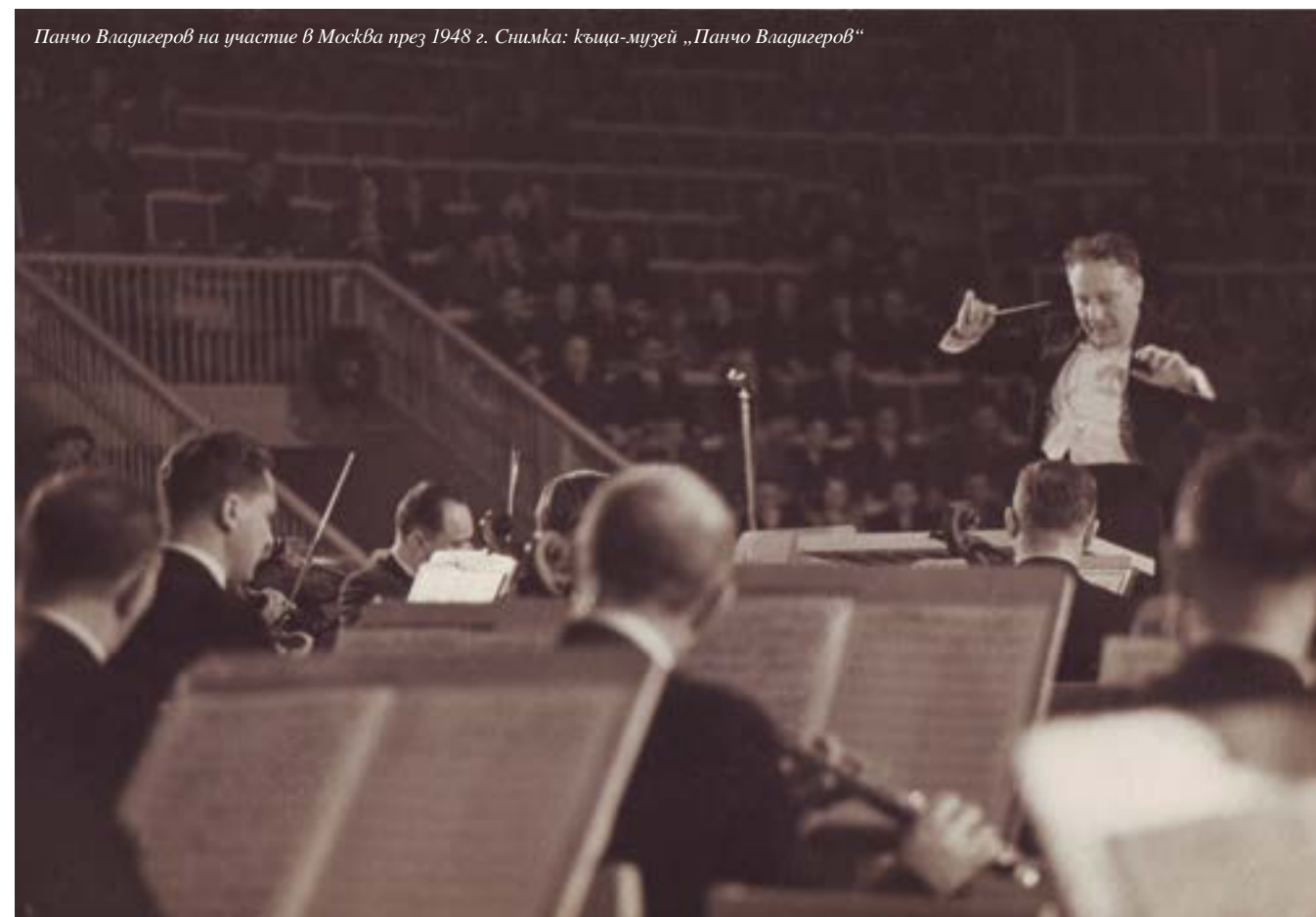
Панчо Владигеров на участие в Москва през 1948 г.

Предвидени са също хореографско и сценично представяне на танците по театралната музика, изложба и документален филм за творческото сътрудничество на Райнхард и Владигеров, театрален уъркшоп, който ще завърши със спектакъл, кръгла