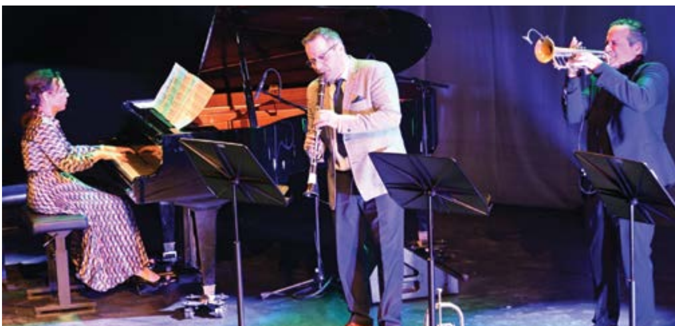
По време на участие.

В нашия случай родствената връзка допълнително подсилва емоционалния градус и това много силно въздейства на публиката.