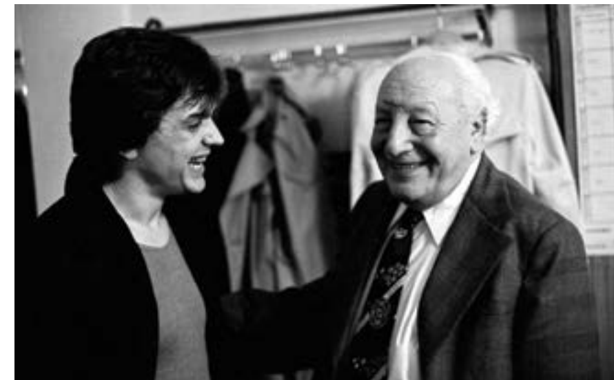
София, 6 юни 1978 г. Софийски музикални седмици. Репетиция на фестивалния оркестър „Симфонета“ в зала „България“ с диригент Емил Чакърлов, пианиста Алексис Вайсенберг и композитора Панчо Владигеров. На снимката: Емил Чакърлов и Панчо Владигеров.

Много почитатели на това изкуство идват на заключителната тържествена вечер в Драматичния театър „Васил Друмев“. За високата оценка и всеобщото