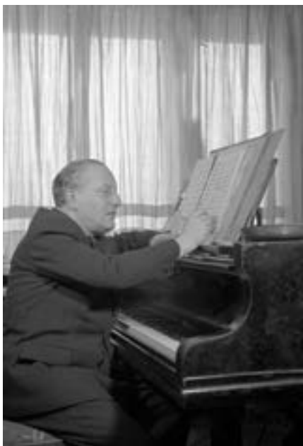
София, 22 януари 1954 г. В дома на Владигеров.

След последното си турне в Германската демократична република и Франция на 4 ноември Софийската гържавна филхармония открива новия си сезон. Под ръководството на диригента Константин Илиев са изпълнени за първи път творбата на Панчо Владигеров „Шумен“ – миниатюри за оркестър, както и Симфония № 3 от Брамс.