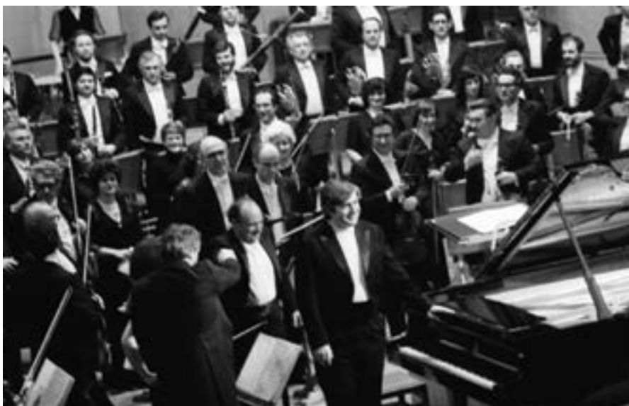
София, 14 март 1984 г. СО на БТР под диригентството на Александър Владигеров и Теодор Мусев – пиано, изнасят концерт с произведения на Панчо Владигеров и така отбелязват 85-годишнината от рождението на композитора.

Участието си са потвърдили известни наши композитори, музикални педагози, изпълнители, изследователи на живота и богатото музикално наследство на композитора.