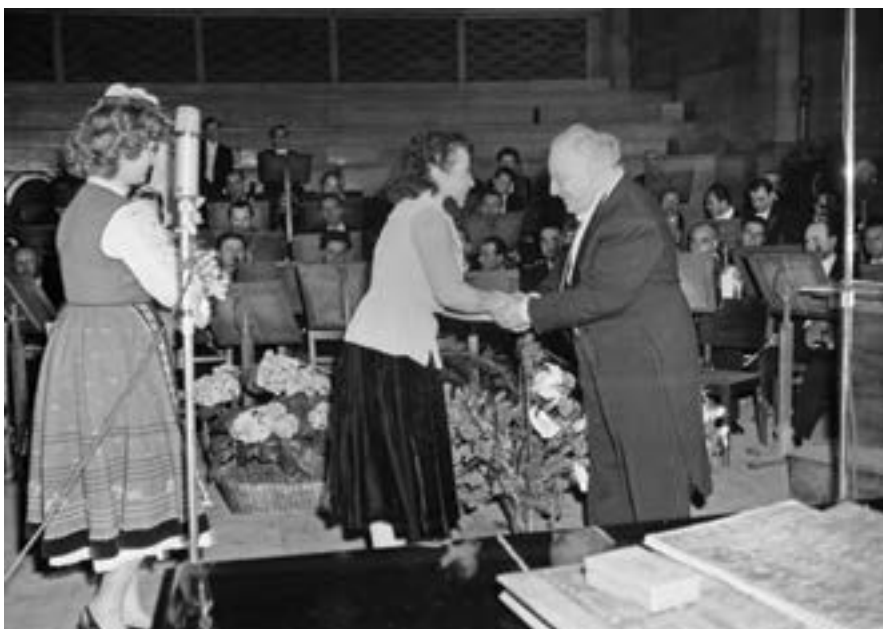
София, 9 април 1959 г. Поднасяне на цветя и приветствия от името на Националния съвет на Отечествения фронт за 60-годишнината на Владигеров в зала „България“.