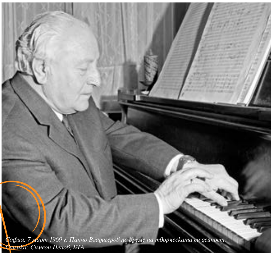
София, 7 март 1969 г. Панчо Владигеров по време на творческата си дейност.

историк и фолклорист професор Михайло Драгоманов, и родената в Одеса лекарка с еврейски произход Елиза Пастернак. От ранно детство най-скъп приятел на Панчо ще бъде синът Димитър Шшманов. Писател, дипломат и музикален критик, Димитър Шшманов ще стане външен министър в правителството на Богдан Филов и ще бъде екзекутиран в злощастната нощ на 1 срещу 2 февруари 1945 г.