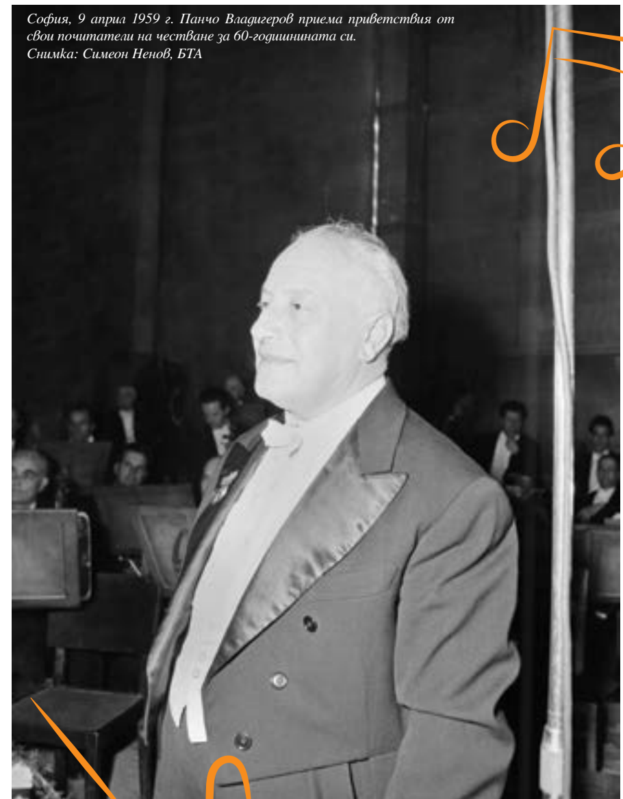
София, 9 април 1959 г. Панчо Владигеров приема приветствия от свои почитатели на честване за 60-годишнината си.

инструмент и оркестър с ярко застъпено концертно качество – бляскаво, пълнозвучно, политемброво, виртуозно и диалогично. Видян като редуване, изчакване, провокация и изказвания на различни участници (солист(и) и оркестър), с различни или еднакви тези, диалогът е основен формообразуващ стимул в концертната жанрова форма, на товарвайки понятията съгласие, единство, конфликт, борба за надмощие, множественост, хармония, равновесие с висока знаковост. И ако музикално-ролевите отношения в клавирния концерт – такъв, какъвто го възсъздава