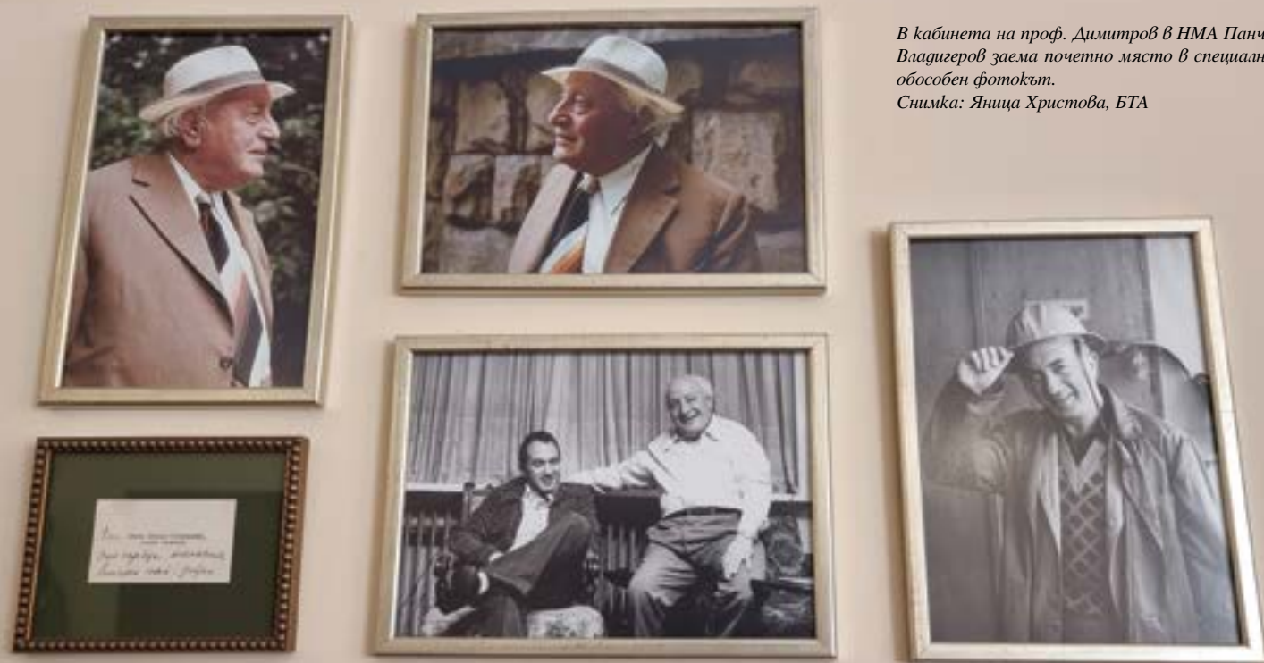
В кабинета на проф. Димитров в НМА Панчо Владигеров заема почетно място в специално обособен фотокът.

100% точност, но имам предположение, и то е доста основателно, че на този инструмент е създадена и рапсодия „Вардар“, или както самият композитор е написал – „Българска рапсодия“, това е второто ѝ заглавие. Това е инструментът, на който авторът е чул първите звуци на това произведение, излезли от него, както и на много други произведения, написани в периода, когато е в Германия. Това са произведения, имащи изключителна стойност и значение за създаващата се по онова време българската композиторска школа.