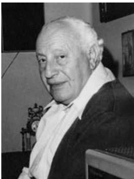
Панчо Владигеров.

че това е първият симфоничен концерт, който ще прозвучи на историческия хълм след 1985 година.