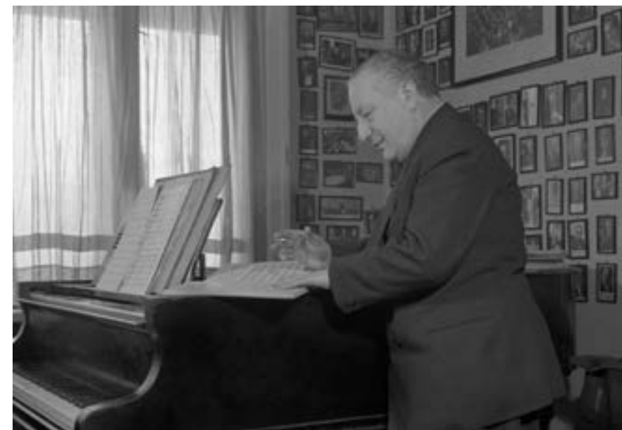
София, 22 януари 1954 г. Народният артист Панчо Владигеров в работна обстановка в кабинета на дома си.