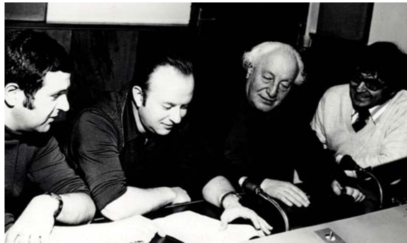
Стефан Лазаров, Васил Казанджиев, Панчо Владигеров и Александър Райчев в студиото на БНР през 1974 г.

Интервюто от 1974 година е предоставено от архивния фонд на БНР. То е публикувано на страниците на списание ЛИК със съкращения и след редакцията на изданието.