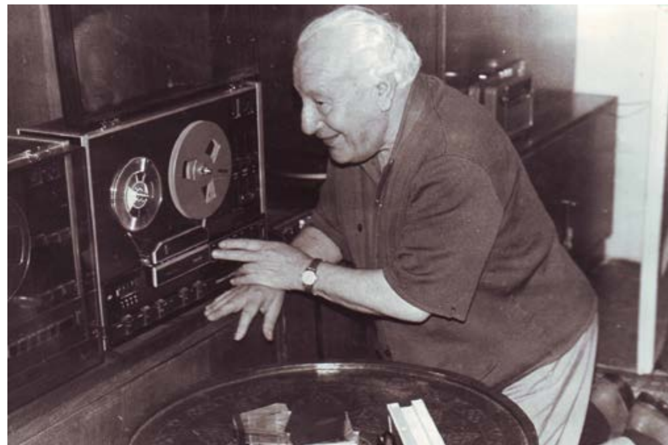
Панчо Владигеров.