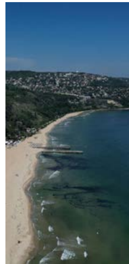
Курортният комплекс погледнат отгоре.

– „Албена“ има своите природни гадености – прекрасен плаж, природен резерват, плитко морско дъно, умерен климат, минерална вода. Важна за нас е и цялостната стратегия за устойчиво използване на тези природни ресурси. Зеленият преход, който правим в тази посока, също ни отличава пред чуждестранните курорти. Важно е гостите да асоциират България и българското море с гостоприемност, приветливост и професионализъм, които вярвам, че отварят врата към сърцето на всеки гост.