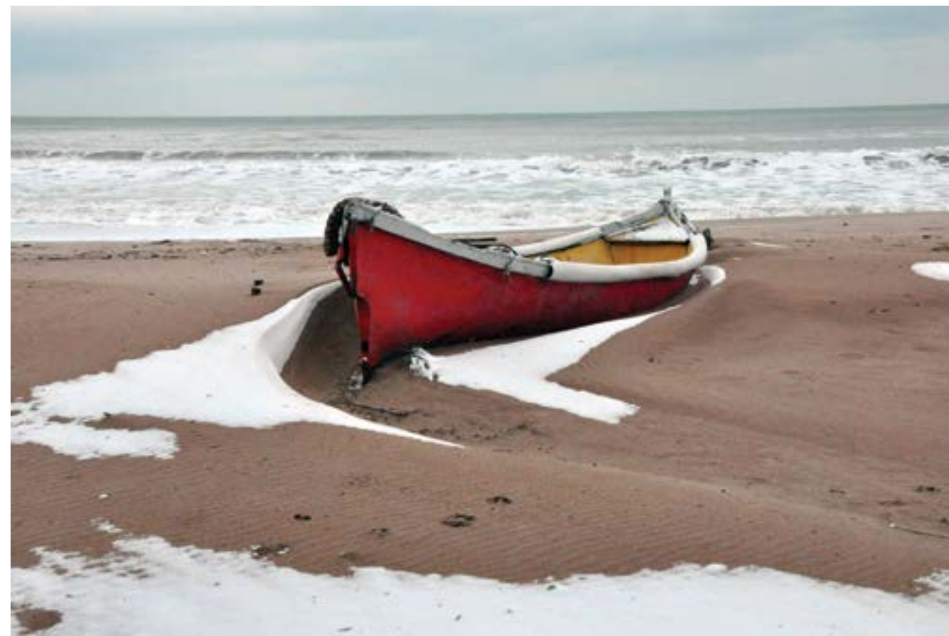
8 февруари 2015 г. Пустият и безкраен плаж на „Албена“ през зимата е интересно за разходка място в почивните дни.

Черноморският комплекс „Албена“ „разказва“ историята си с архивни снимки и пощенски картички и представя развитието на морския туризъм в България в изложба, която се открива на Моста на влюбените до НДК в София на 9 април. Колекцията „45 години „Албена“ е подредена в галерията на открито в партньор-