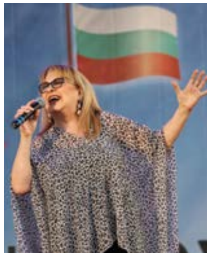
Маргарита Хранова.

Разговор за едноименната песен с поета Недялко Йорданов и певицата Маргарита Хранова