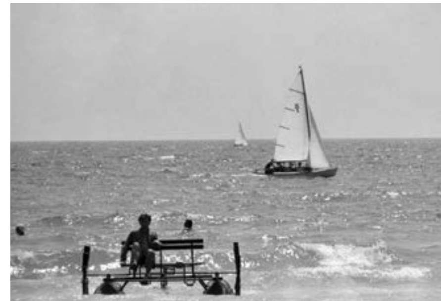
10 юни 1974 г. „Албена“.

Библиотеката в комплекса разполага с 14 000 тома художествена литература на български, руски, немски, английски, испански, френски и полски език. По-голямата част от читателите ѝ са деца от различни страни, които почиват с родителите си по Добруджанското Черноморие.