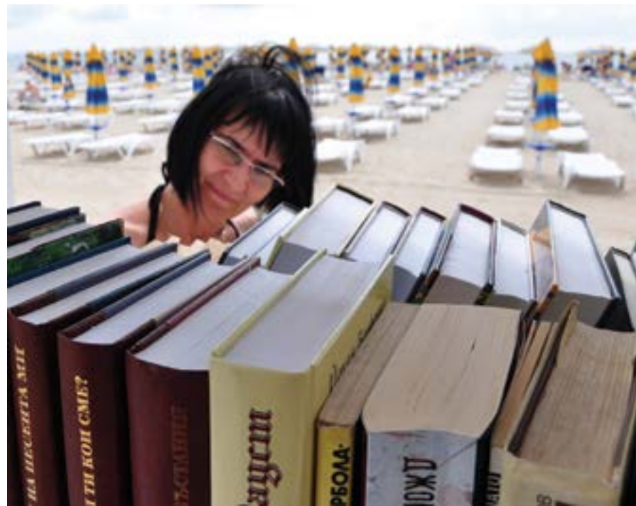
5 юли 2013 г. Откритата в „Албена“ плажна библиотека се радва на първите си читатели.

Черноморският комплекс „Албена“ за първи път ще се пред-