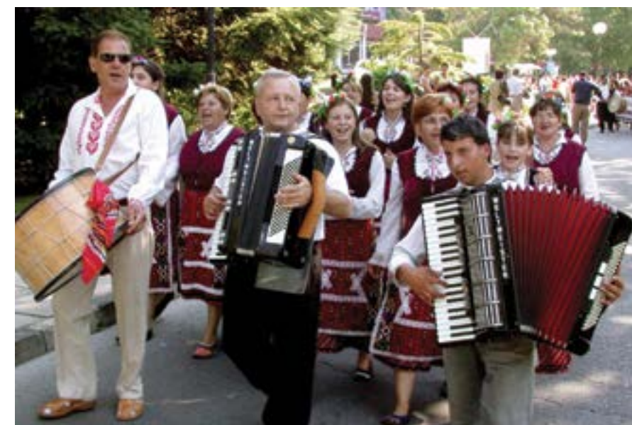
25 юни 2006 г. Участници в дефилето на шестото издание на „Фолклор без граници Добрич – Албена 2006“.