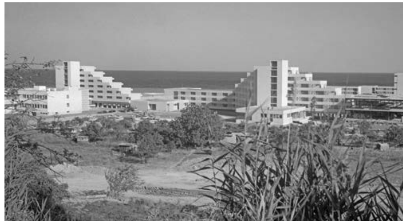
10 август 1969 г. „Албена“.

Когато бях студент, имахме един професор Марковски по архитектурно проектиране, който казваше какво е типичното за удачната архитектура. Това е когато искаш нещо да внесеш или нещо да махнеш, но все не става. Първоначалното, ори-