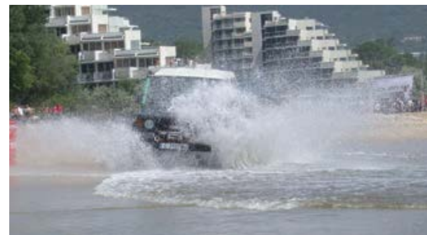
8 юни 2002 г. Състезание с джипове се провежда в рамките на фестивала „Телевизионен свят 2002“ на плажа пред хотел „Гергана“. В ралито участват над 32 екипажа.

Всъщност спортният туризъм направи целогодишен българския курорт по Черноморието, който традиционно е място за летен отдих. Дори и капризни български и чуждестранни футболни клубове избраха „Албена“ за по-добрата си подготовка през паузата на шампионатите. Тук е най-доброто място с всички необходими условия за работа, смятат от Иранската федерация по вдигане на тежести и доведоха за цял месец край българското море своите щангисти. На „Албена“ се проведе първото национално първенство по хокей на трева. А един от клубовете, който може да си позволи и по-дълготрайни лагери – женски-