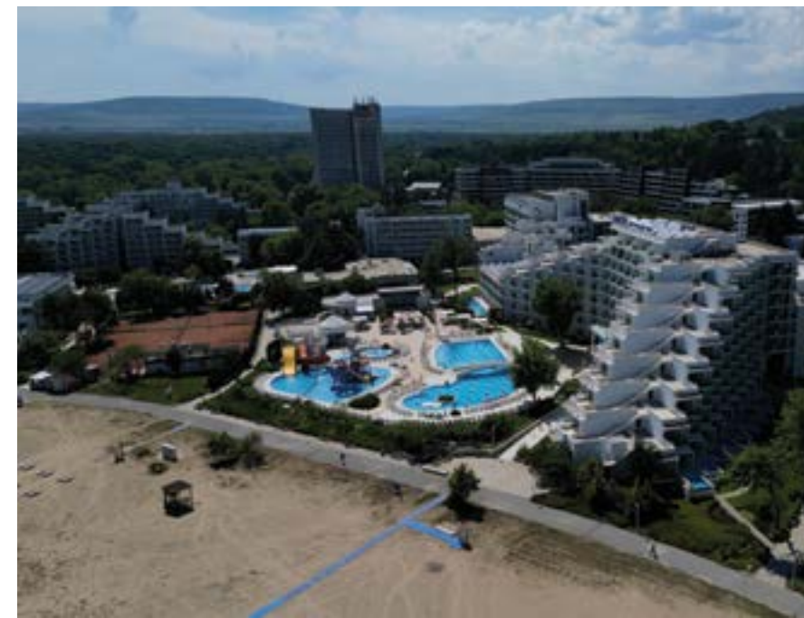
„Албена“ през май 2024 г.

– Смятам, че липсва дългосрочна държавна политика за неговото развитие. Препятствие са бавните административни