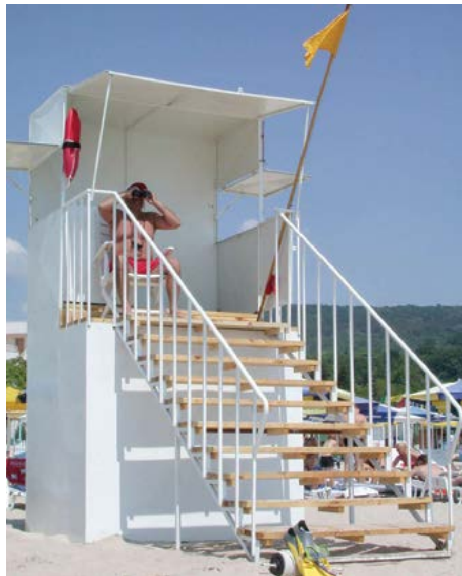
14 юни 2002 г. От спасителите на плажа пред хотел „Калиона“ е поставена 2,5-метрова кула. Така те имат по-добра гледна точка на обстановката в морето и ще могат по-добре да се грижат за безопасността на туристите.

„Ралица“, „Орхидея“ и „Варшава“ също изцяло сменят облика си. След модернизацията тризвездните хотели трябва да отговарят на формулата „всичко е включено в цената“ и „всякакви прищевки на летовниците ще бъдат изпълнявани на място“. „Варшава“ сменя името си и става „Оазис“.