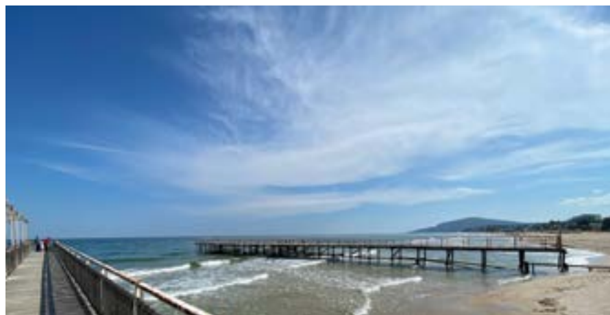
„Албена“ през лятото на 2024 г.