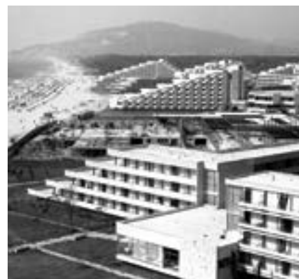
„Албена“ през октомври 1969 г. и юли 1970 г.

бе привично например от тогавашния курортен комплекс „Слънчев бряг“ (а колко се пре-застрои сега „Слънчев бряг“!). Но има и още нещо много важно – тогава още почти не бе се развила новозасадената растителност, не се чувстваше замисълът в ландшафтната архитектура. А трябва да посоча, че „зеленото строителство“ на пясъчливата и засо-лена почва тук бе истинско предизвикателство, с което строителите на комплекса се справиха. Днес в „Албена“ израсналата дървесна и храс-това растителност както с местни видове, така и с екзо-тични, горната зона с нейните лозници и бадеми, горският ре-зерват „Балтата“ сполучливо допълват и обогатяват архи-тектурните обеми, предста-вяват чудесно допълнение за отдиш на открито 5 .