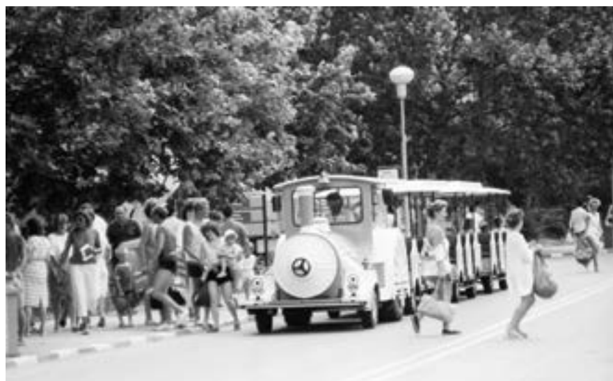
6 август 1987 г. „Албена“.

за 35 на сто от анкетираните. В социологически анализ, публикуван в местния вестник „Добруджанска трибуна“, се посочва, че за 61 на сто от туристите цената на храната в заведенията е нормална, а за 62 на сто – и цената на алкохолните напитки. Малко по-малко са съгласните с ценоразписа на стоките в магазините – 46 на сто считат, че са в границата на разумното. Не са забелязали да са излъгани в заведенията за хранене и признават коректността на сервитьорите в сметката близо 74 на сто от участвалите в анкетата. Отлична обща удовлетвореност от почивката си в „Албена“ изразяват 22 на сто, също толкова слагат оценка „задоволителен“, а напълно недоволни са 3 на сто. Повече от половината определят като „добро“ пребиваването в курортния комплекс – сочи социологическият анализ.