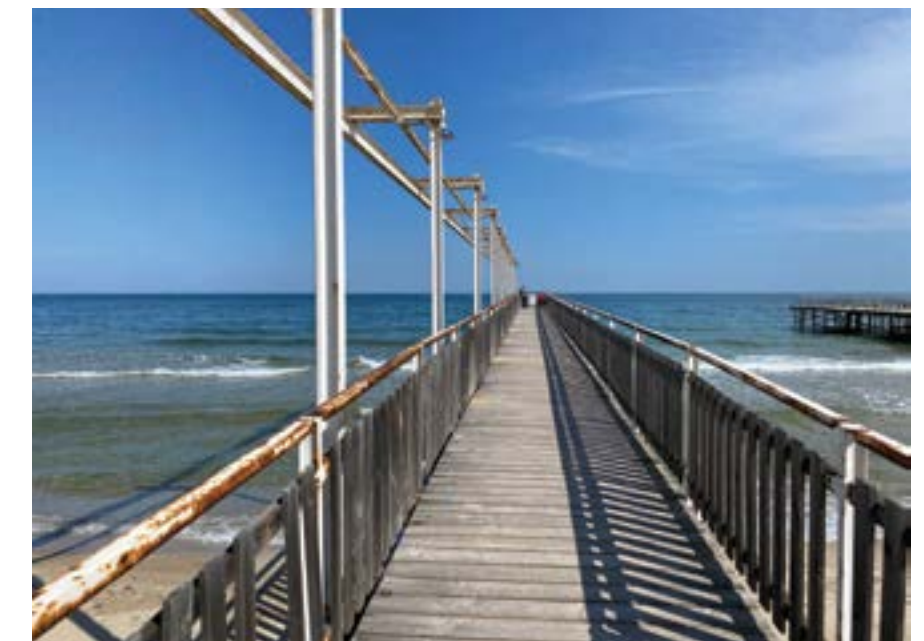
„Албена“ през лятото на 2024 г.