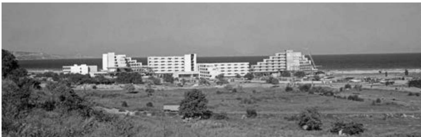
10 август 1969 г. Изглед от новия курортен комплекс „Албена“.

цялостния образ. За съжаление, „новото време“ (след 1989 година) раздроби тяхната единна и добре благоустроена територия на отделни частни имоти. Желанията на собствениците за по-големи печалби доведе до по-интензивно застрояване, пристрояване, надстрояване или изцяло ново преизграждане на съществуващите хотели, които на практика изчезнаха или се обезличиха от тези намеси. Архитектите получиха по-голяма свобода да фантазират, но това замени предишната ансамбловост с оразнеца, посвоему безлична пъстрома. Така тези наши курорти от „първо поколение“, особено курортния комплекс „Слънчев бряг“, загубиха предишния си характер, богатото присъствие на природата и основната ценност на техния пейзаж - тяхната ансамбловост.