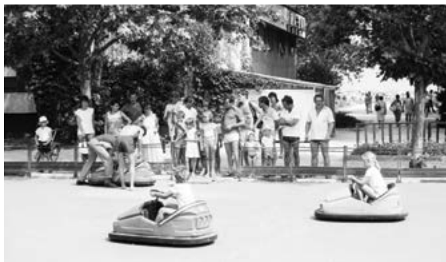
6 август 1987 г. „Албена“.