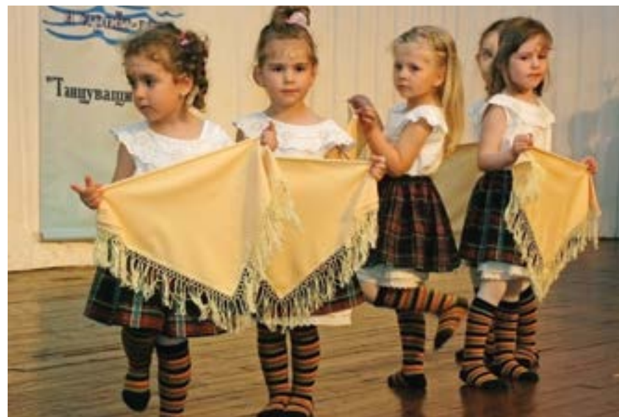
9 май 2009 г. Над 200 деца от Чирпан, Дутица, Русе, Добрич и Тервел участват в първото издание на Международния фестивал – конкурс за съвременни характерни танци и стрийт денс „Танцуващи вълни“, организиран от Сдружение „За децата“. Фестивалът се провежда в концертната зала на Културно-информационния център на курортен комплекс „Албена“.

В курорта ще бъде построена нова спортна зала с 4000 квадрат-