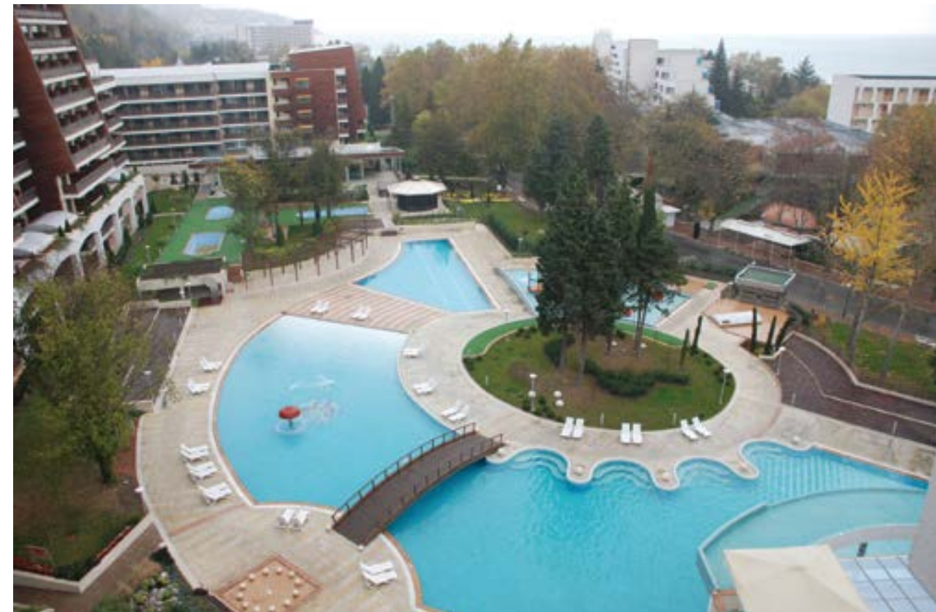
13 ноември 2008 г. Най-новият петзвезден хотел „Фламинго Гранд“ и СПА центърът към него в курортния комплекс „Албена“.