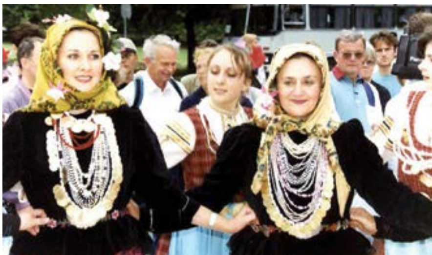
6 септември 1999 г. 27 състава от 8 държави участват в четвъртото издание на Международния фолклорен фестивал „Добруджа пее и танцува“.