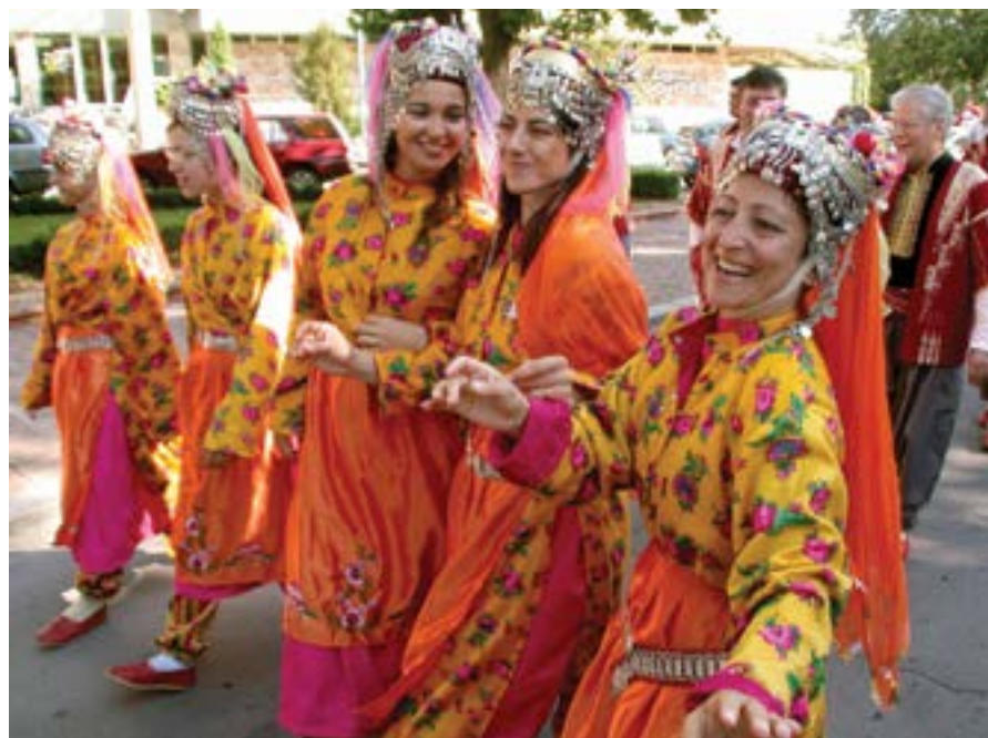
25 юни 2006 г. Координатно дефиле се провежда по улиците на курортния комплекс в рамките на шестото издание на Международния младежки фолклорен фестивал и конкурс „Фолклор без граници Добрич – Албена 2006“, в който участват над 650 изпълнители от 8 държави.

миналата година отбелязва отиващият си туристически сезон, съобщава Маргита Тодорова, директор „Маркетинг и реклама“ в „Албена“ АД. По нейните думи голямо увеличение – около 70 на сто, има и на гостите от Великобритания. Българските туристи са с 15 на сто повече, като на ден в курорта са почивали средно по 2000 летовници от страната.