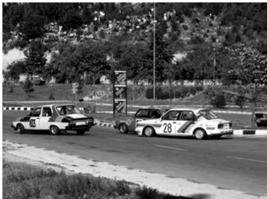
29 септември 1986 г. В „Албена“ се провежда седмият заключителен кръг по автомобилизъм, част от шампионата на социалистическите страни за купата „Мир и дружба“.

На 7 юни в „Албена“ завършва международното съвещание по проблемите на системния анализ и моделирането на отрасъла „Гори и горска промишленост“. Учасстват специалисти и научни работници от 16 страни, както и представители на организациите на ООН по прехрана и земеделие (ФАО) и за индустриално развитие (ЮНИДО) и на Международния институт по приложен системан анализ във Виена (МИПСА).