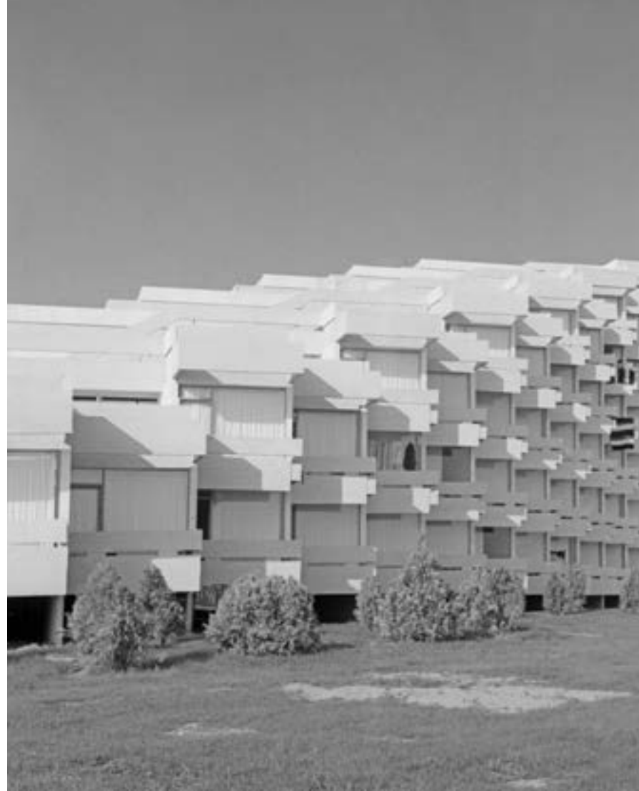
3 октомври 1969 г. „Албена“.

Много добре работих с арх. Ненов, защото той беше изключително ерудиран човек. Той смяташе за свое откритие пропорцията 3-4,20-2,60 – това е 3 метра ос, 4,20 метра дълга стая, 2,60 метра висока стая. Тези показатели са в основата на градоустройствените решения. Това действително беше интересно