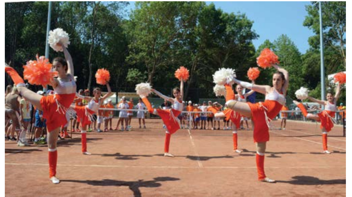
23 юни 2017 г. В „Албена“ е открит модерен тенис комплекс, където ще се проведе третото издание на Международния турнир за деца „Royal cup“.