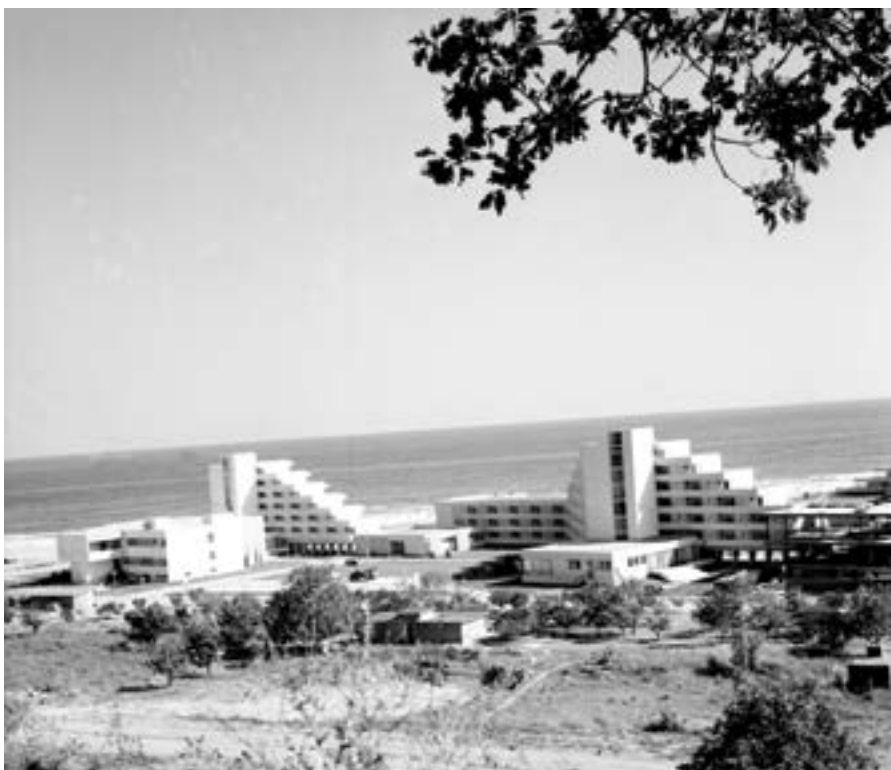
2 октомври 1969 г. Изглед от новия черноморски курортен комплекс „Албена“.

на международния туризъм в България. Той съобщава, че през следващата година ще започне изграждането на новия курортен комплекс „Албена“ с хотели с 10 000 легла, ще започне да се осъществява и нова програма за разширяването на зимните курорти. През 1968 година курортните комплекси ще бъдат увеличени със 7000 легла. Броят на местата в къмпингите ще се увеличи с нови 18 000-20 000 места; общо с частните квартири ежедневно в нашата страна ще има 200 000 места за нуждите на туризма. Големите улеснения, които са създадени у нас – като безвизов режим през тази година, облекчаването при митническите и други формалности – привлича все по-голям брой туристи.