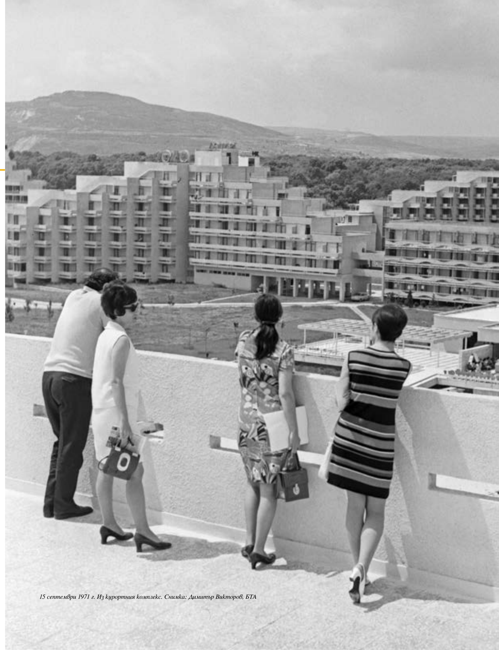
15 септември 1971 г. Из курортния комплекс.