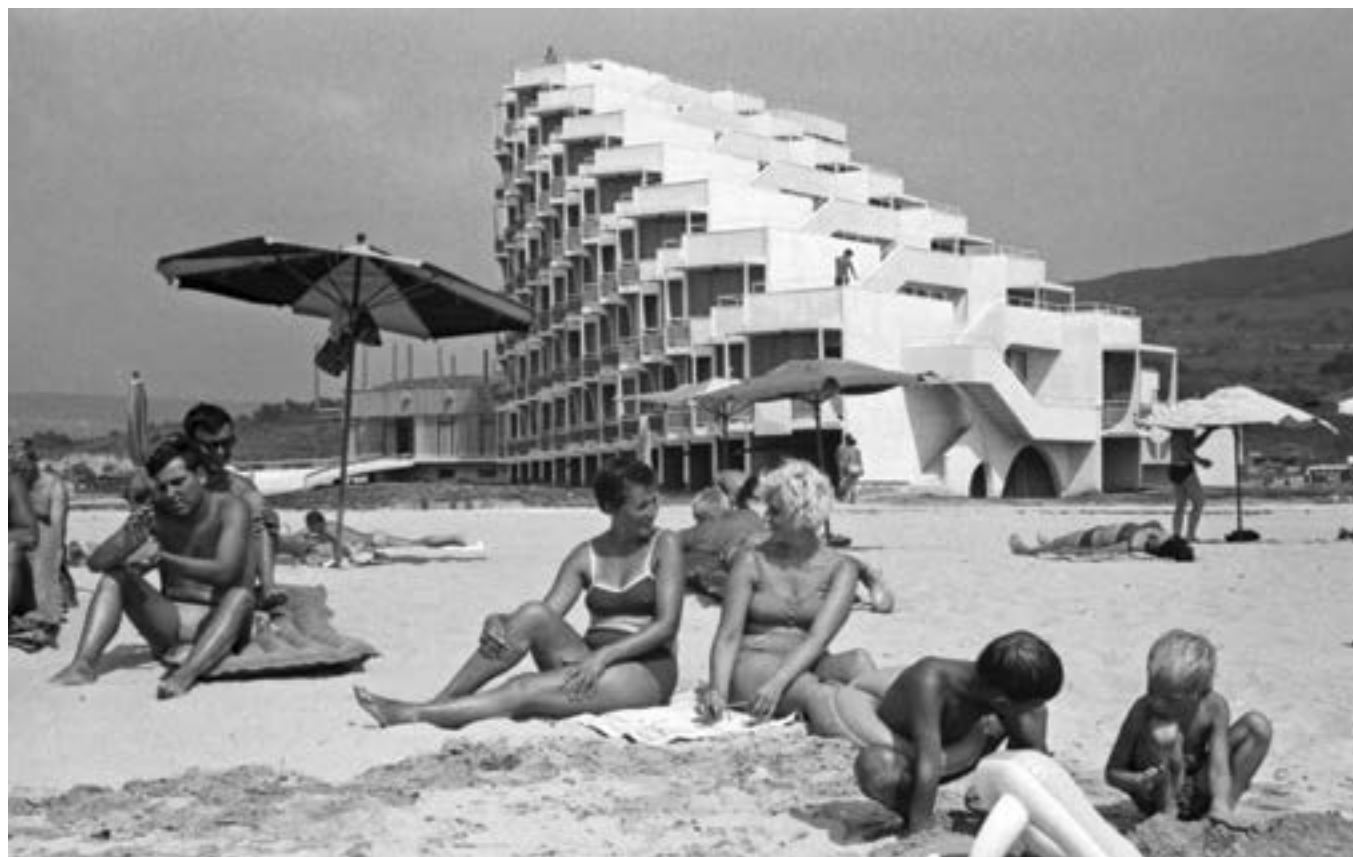
13 август 1970 г. Черноморският курортен комплекс „Албена“ в Толбухински окръг (сега - област Добрич).

град на Черноморието – Балчик, курорта „Албена“ и битовото заведение „Кукерите“, пише в новина от 26 октомври.