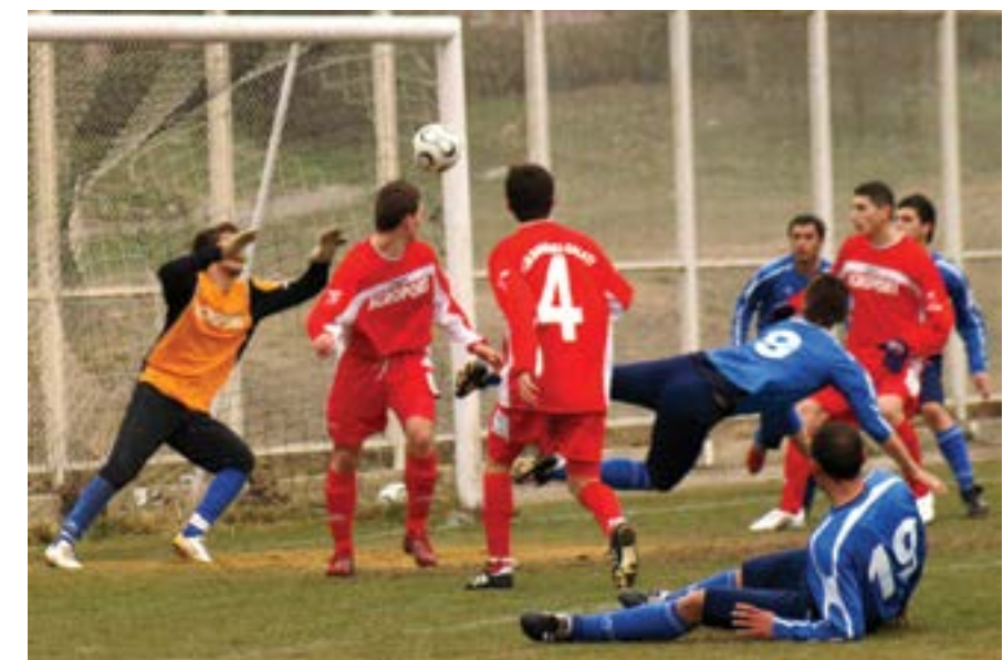
6 февруари 2008 г. Контролна среща по футбол между „Калиакра“ (Каварна – сини екипи) и румънския втородивизионен отбор „Дунарея“ (Галаци), която се играе в „Албена“.

Сред атракциите в курорта за новия туристически сезон ще бъдат и мексикански, кубински и