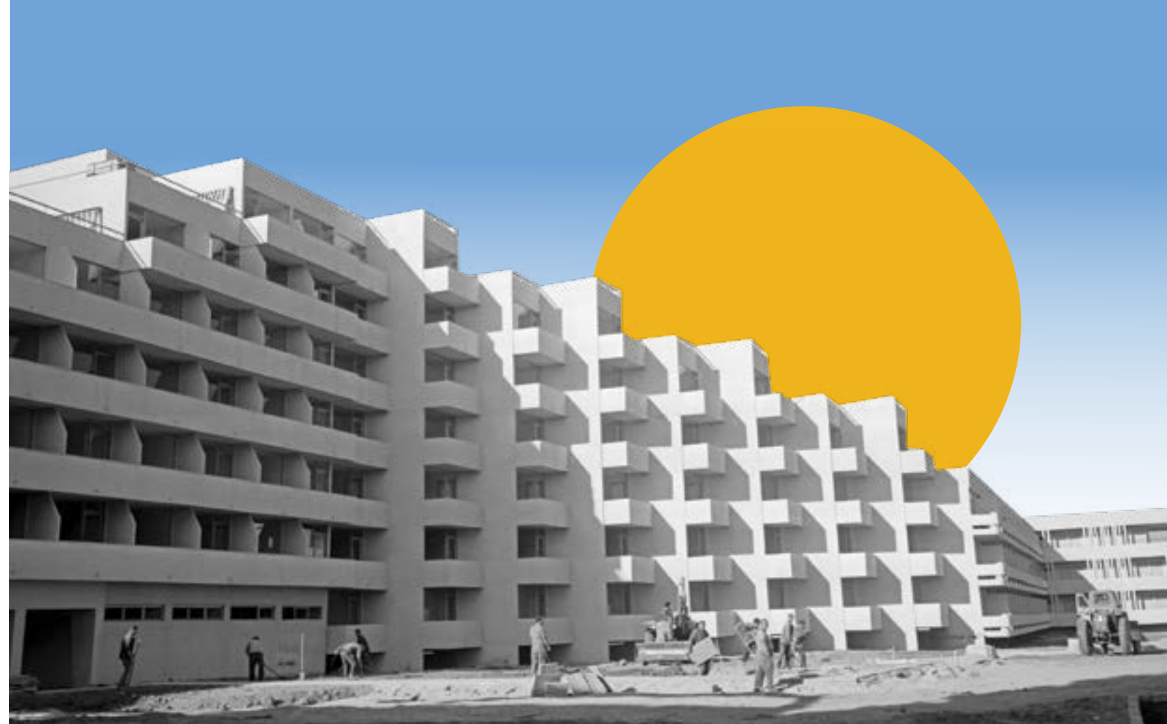
10 август 1969 г. „Албена“.