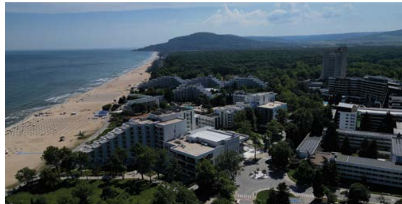
„Албена“ през май 2024 г.

те на песента и разговаря както с автора на текста, така и с популярната изпълнителка, за да научи повече как се появява идеята за творбата и как тя оставя своята следа в музикалната история и в историята на „Албена“.