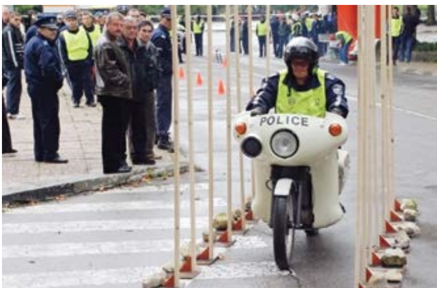
27 септември 2008 г. „Албена“ е домакин на 17-то Национално състезание пътен полиция на годината. То включва майсторско управление на мотоциклета и автомобила, стрелба с лично оръжие, оказване на първа помощ на пострадали и др.

за цялостен принос в подкрепата на българската култура и за инициативата на агенцията – Първа световна среща на Българските медуш.