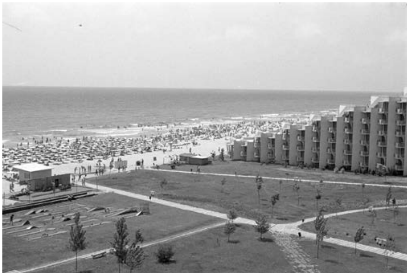
23 август 1973 г. „Албена“.

та комисия по стандартизацията на СИВ. Обсъдени са проблеми по някои видове опаковки и изпитването им на проникваемост и физико-механични въздействия, маркировка и групи.