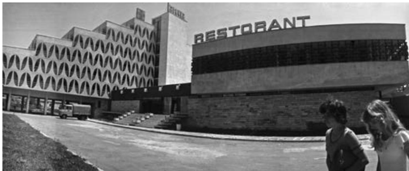
10 юни 1974 г. В черноморския комплекс „Албена“.