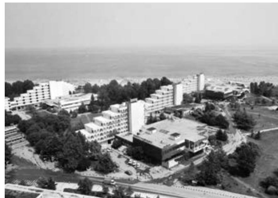
28 юни 1989 г. „Албена“.