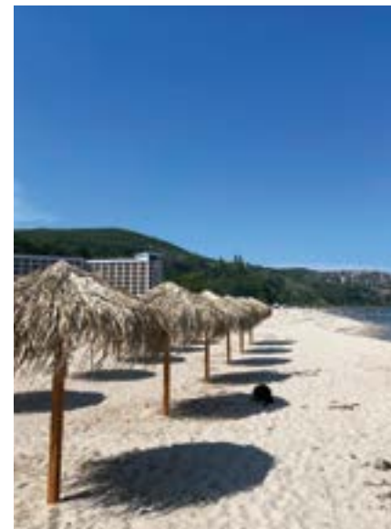
„Албена“ през лятото на 2024 г.

През юли концесия върху минералните води на територията на курорта „Албена“ получи акционерното гружество „Албена“ от Министерството на околната среда и горите. Договорът е подписан от министъра на околната среда Евдокия Манева и изпълнителния директор на гружеството Красимир Станев.