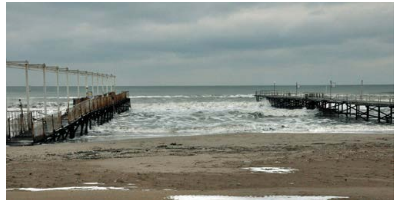
8 февруари 2015 г. Зимна разходка из плажа на „Албена“.

Повечето от децата никога не са отгъхвали на море и за тях почивката на брега ще бъде из-