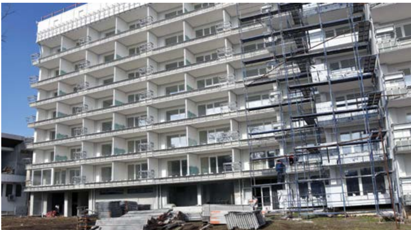
29 януари 2022 г. В курорта „Албена“ вече започва подготовката за новия сезон и се правят текущи ремонти.

канционното селище. Режисьор на постановката е Пламен Карталов.