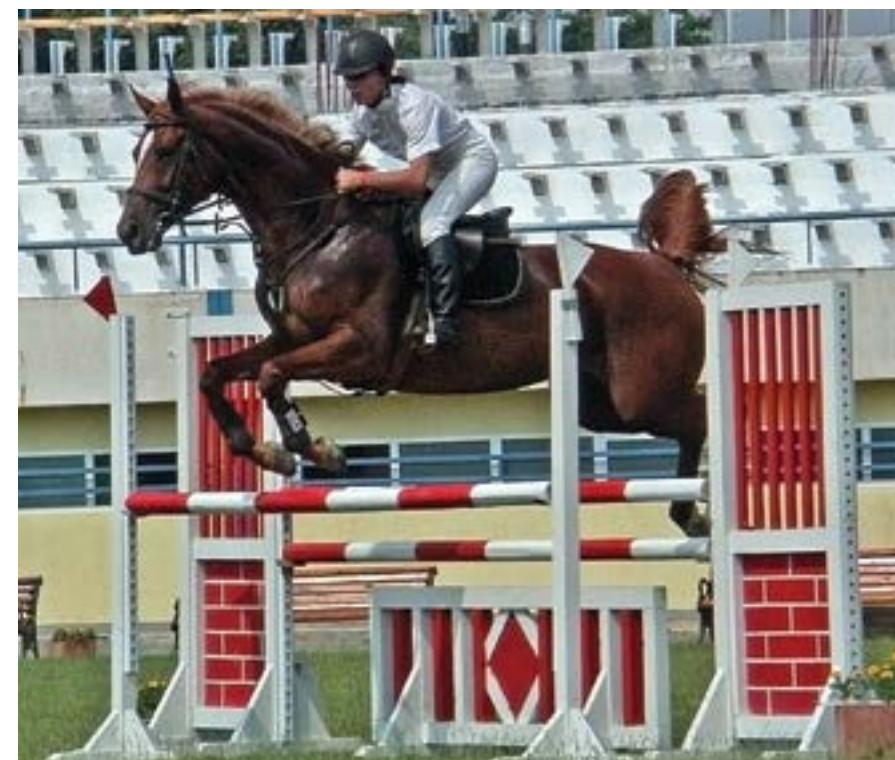
2 юли 2005 г. Жокеи от 7 държави участват в петия Международен турнир по конен спорт, организиран от Българската федерация по конен спорт.

Селище от 35 наколни гървени къщици за приключенски туризъм ще бъде построено край чер-