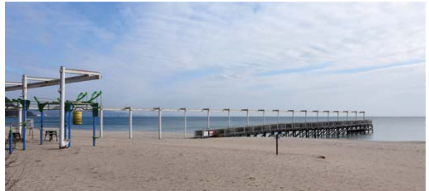
29 януари 2022 г. „Албена“ се подготвя за предстоящия туристически сезон.

За новия туристически сезон по периферията на резервата „Балтата“ и край плажа ще бъдат обособени места за паркиране на кемпери и каравани, съобщават от пресцентъра на черноморския комплекс „Албена“ през май. С