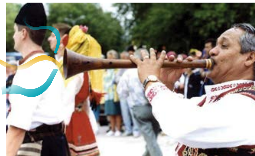
6 септември 1999 г. Участници в Международния фолклорен фестивал „Добруджа пее и танцува“.

Съгласно контракта първите 30 на сто от цената трябва да бъдат платени в брой до 7 банков работни дни. Остатъкът трябва да бъде издължен до 30 работни