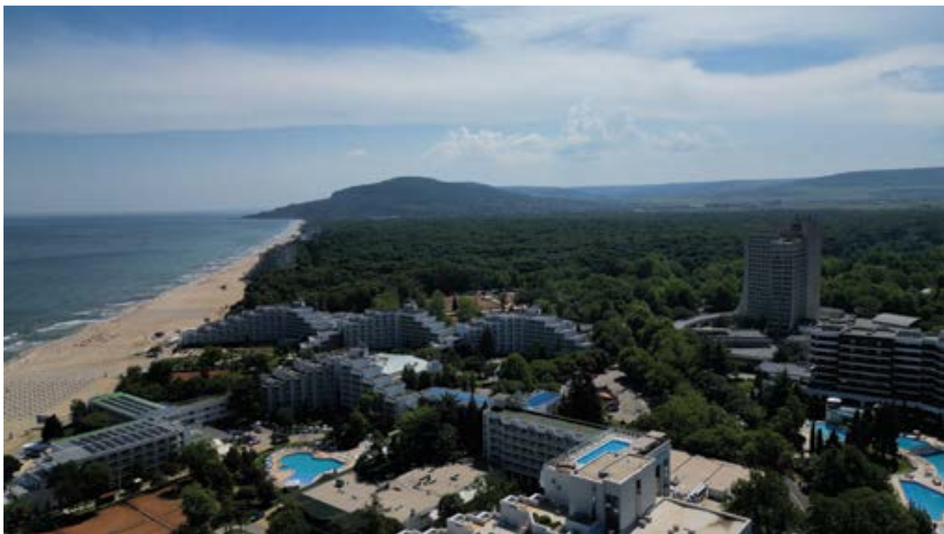
Курортният комплекс заснет с дрон.

правим само на мястото на стари. В „Албена“ няма безразборно строителство и това се оценява високо от нашите гости.