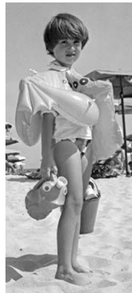
10 август 1979 г. Малък летовник на плажа през годината, в която курортният комплекс „Албена“ навървява 10 години.

Два пъти в месеца в „Албена“ се извършват и измервания на параметрите на околната среда според изискванията на Европейската фондация за екологическо възпитание. През специализирана лаборатория преминават всички хранителни продукти, предназначени за заведенията за хранене. Заедно с рекламните листовки и дуплянки летовниците получават и бюлетин с данните за въздуха и водата в курорта.