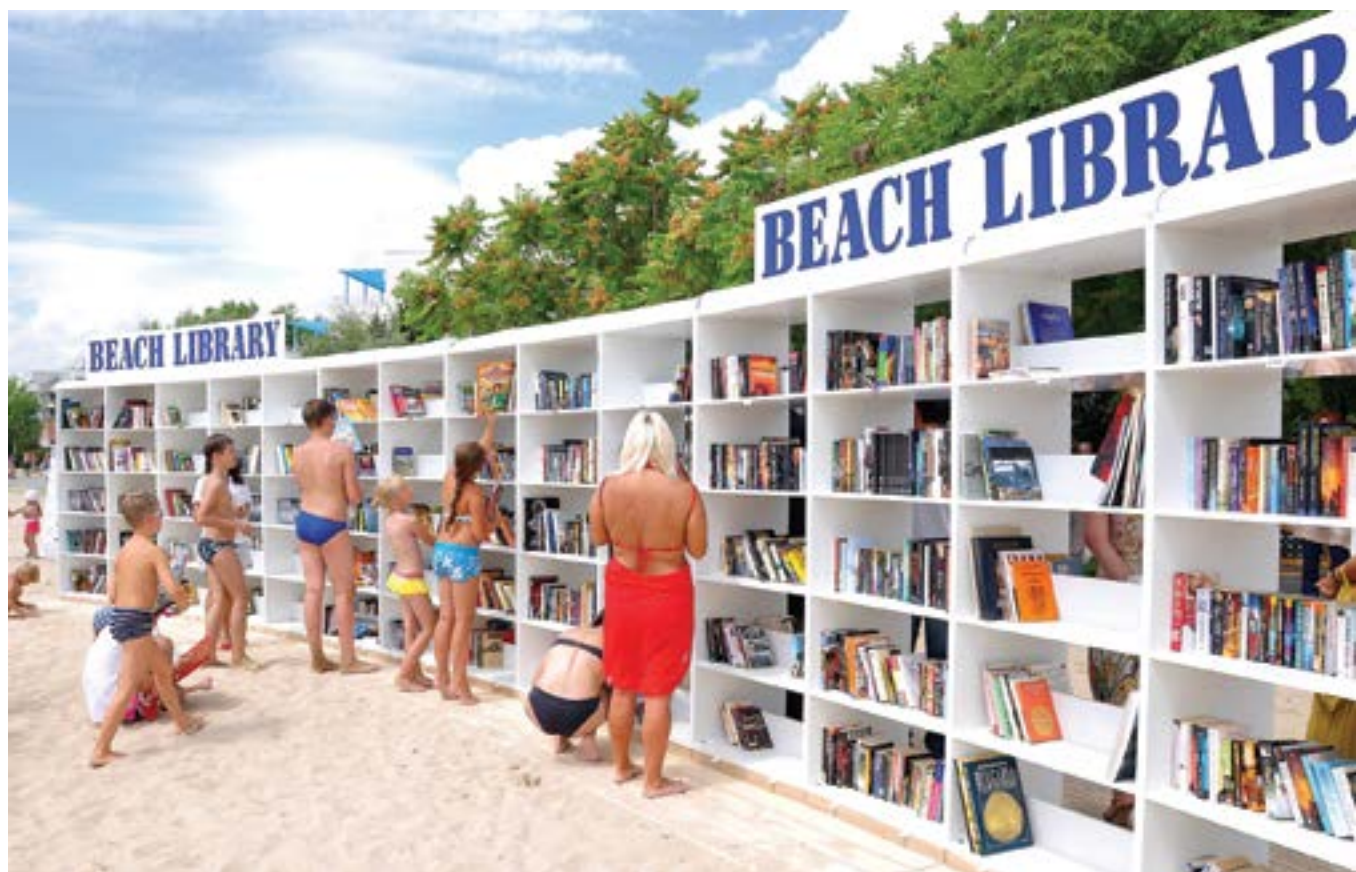
5 юли 2013 г. В „Албена“ е открита първата в Европа плажна библиотека. Тя е напълно безплатна и има за цел да предложи на туристите допълнително забавление по време на почивката им.

щанд, на който оферти са предложени шест голф игрища и два голф туроператора. Четиринайсетото издание на форума е събрало близо 350 специализирани туроператори, чиято дейност се отразява от 140 международни медии.