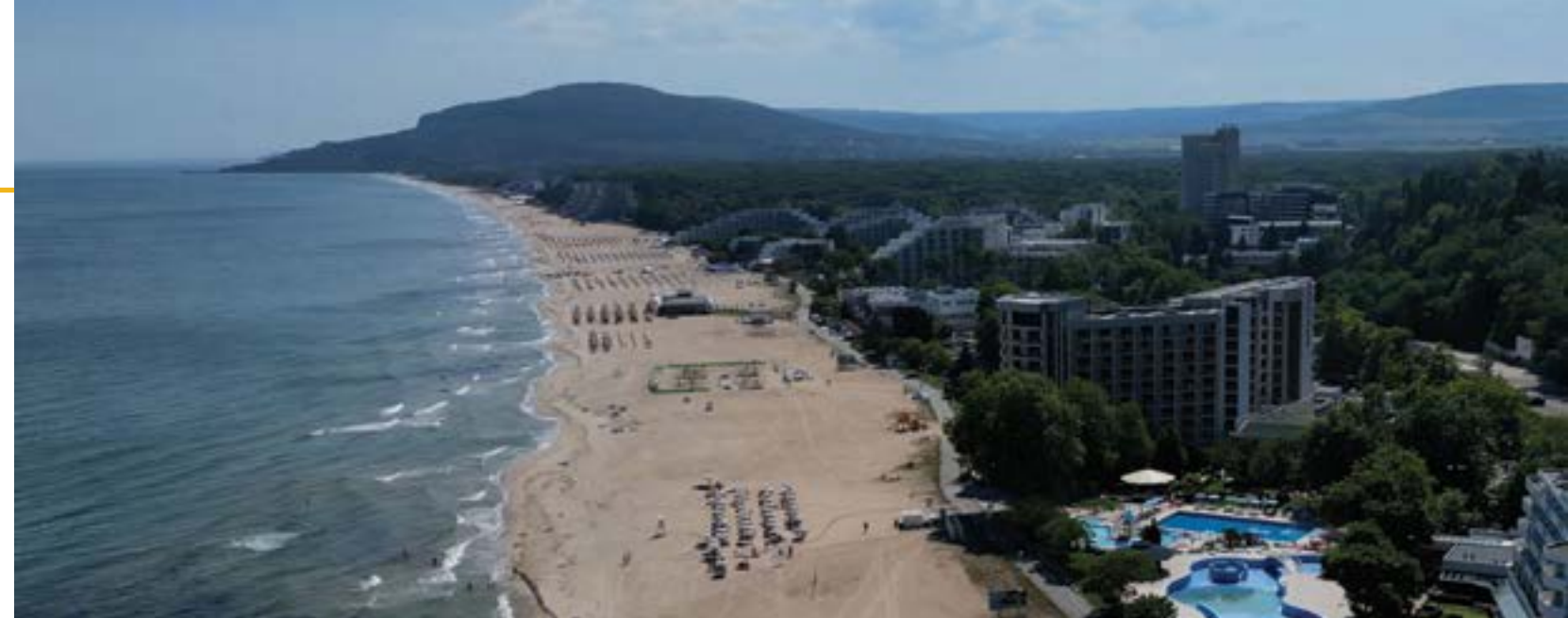
„Албена“ през май 2024 г.