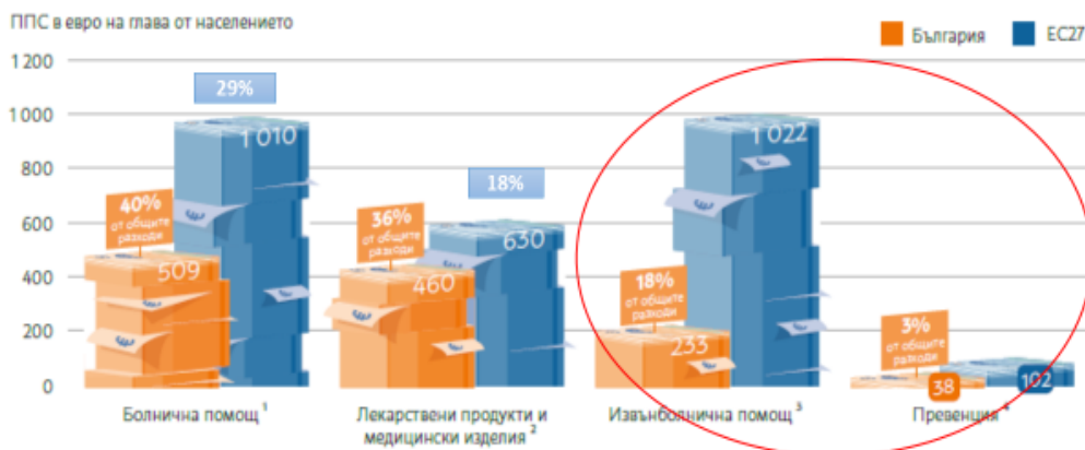
Фигура 9. Разходите за извънболнична помощ в България са само една четвърт от съответните разходи в ЕС като цяло

5 ПЪТИ ПО-МАЛКО СРЕДСТВА ЗА ИЗВЪНБОЛНИЧНА ПОМОЩ