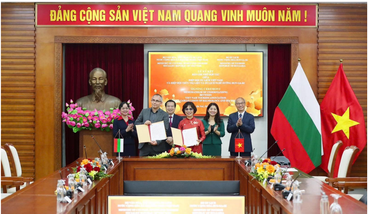
След подписването на Меморандумът за сътрудничество