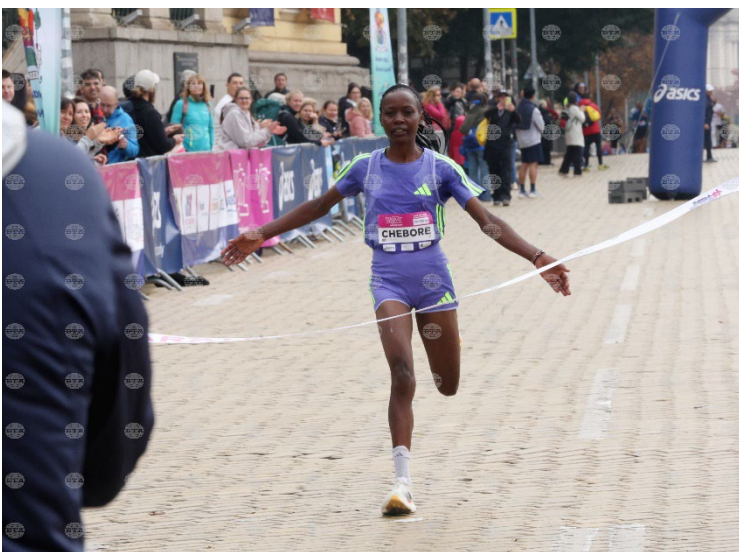
При дамите през 2024 година убедителна победа в дистанцията от 42 километра и 195 метра записва кенийката Хариет Чеборе с 2 часа, 38 минути и 25 минути.