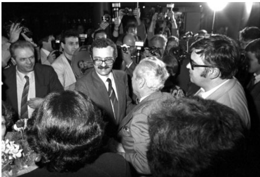
София (01 април 1986) Официално посрещане на аерогара София на Сергей Иванов Антонов.