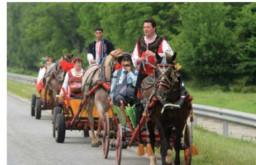
4 юни 2017 г. Розобер в розовите масиви край казанлъкското село Крън

Част от операта „Кармен“ на Бизе ще представят по време на тазгодишния Празник на розата в Казанлък възпитаници на детска градина „Мечо Пух“ в града. Това съобщава в началото на февруари за БТА Аксения Тилева, директор на детското заведение. За спектакъла децата ще бъдат подготвени от художествени ръководители от Операта и балета в турския град Мерсин. Представлението е част от международен проект „Творческо и иновативно обучение на деца, базирано на дигитални материали и игри“. Проектът е с най-голямото финансиране за дейности по програма „Еразъм+“ и продължава до август 2018 година.