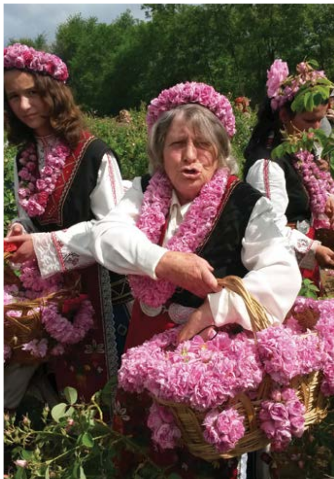
29 май 2017 г. По случай Празника на розата в село Горно Черковице, община Казанлък, също се провежда традиционният „Розобер”