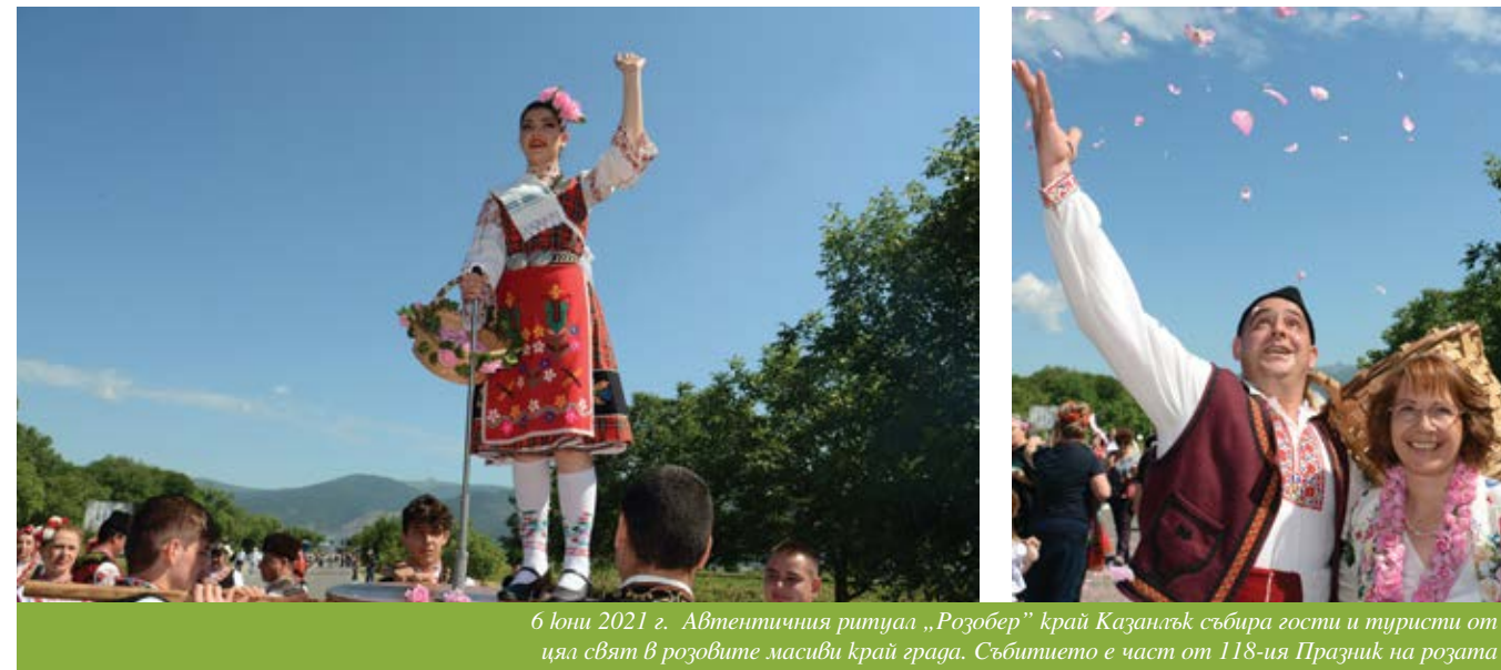
6 юни 2021 г. Автентичния ритуал „Розобер” край Казанлък събира гости и туристи от цял свят в розовите масиви край града. Събитието е част от 118-ия Празник на розата

Празникът на розата в Казанлък да се включи в нематериалното културно наследство на ЮНЕСКО, предлага генералният директор на ЮНЕСКО Ирина Бокова по време на деловата сре-