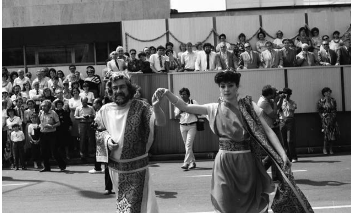
Казанлък, 2 юни 1986 г. Моменти от празника