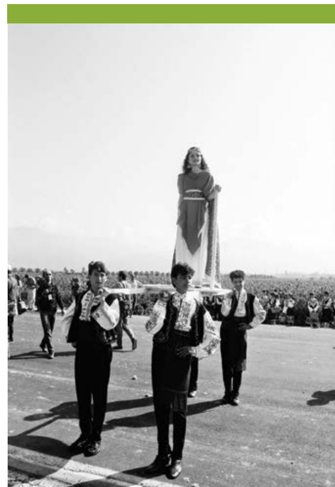
5 юни 1989 г. Празникът на розата в Казанлък

На 8 юни Казанлък отново оживява с настроението на един празник, надживял векове. По традиция в началото на розобера се организира наро-