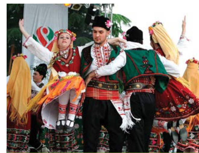
3 юни 2005 г. С фолклорни изпълнения на български състави е открит Международният фолклорен фестивал „Магдебета на Балканите“, който се провежда в рамките на Празника на розата в Казанлък

В рамките на събитието се обсъжда законопроект за защита на розопроизводителите. Инвеститорски интерес към българското розопроизводство е проявен от японския град Фукуяма и от френската фирма „Шанел“. Японците искат да