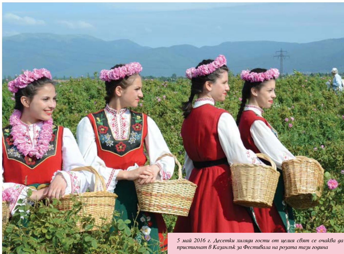
5 май 2016 г. Десетки хиляди гости от целия свят се очаква да пристигнат в Казанлък за Фестивала на розата тази година

кокачествени продукти, да търси българското!”, пожелава тя на производителите, които са от цялата страна.