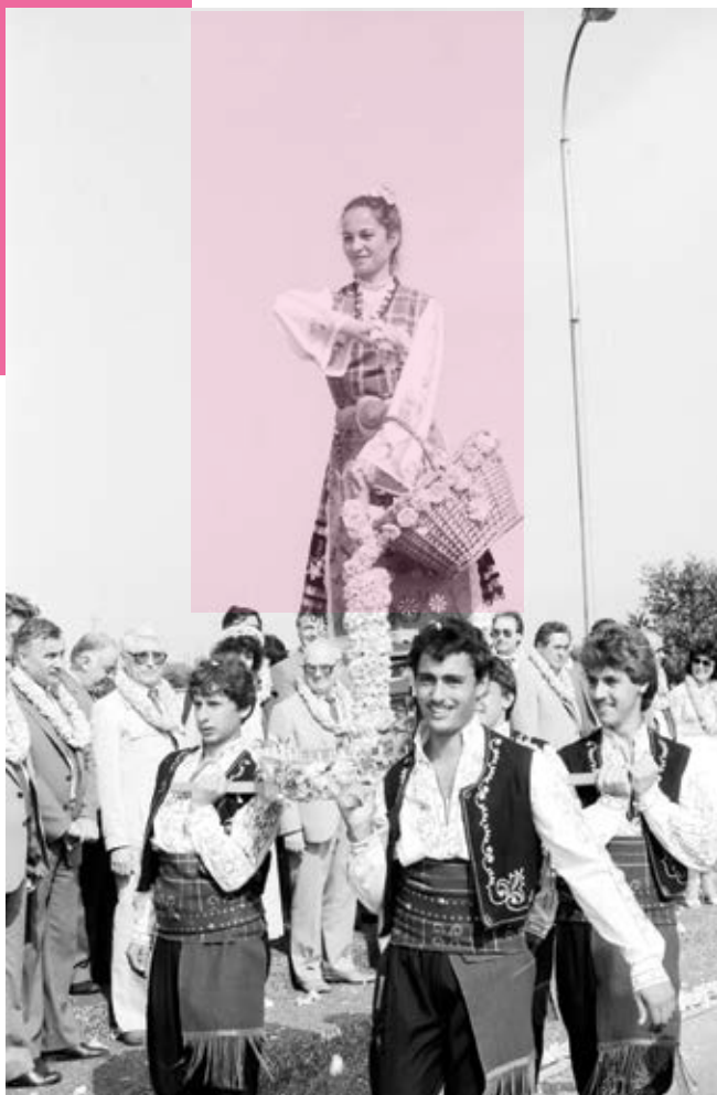
1 юни 1986 г. Празник на розата в Казанлък

което намира напоследък все по-широко приложение в парфюмерийната и козметичната промишленост.