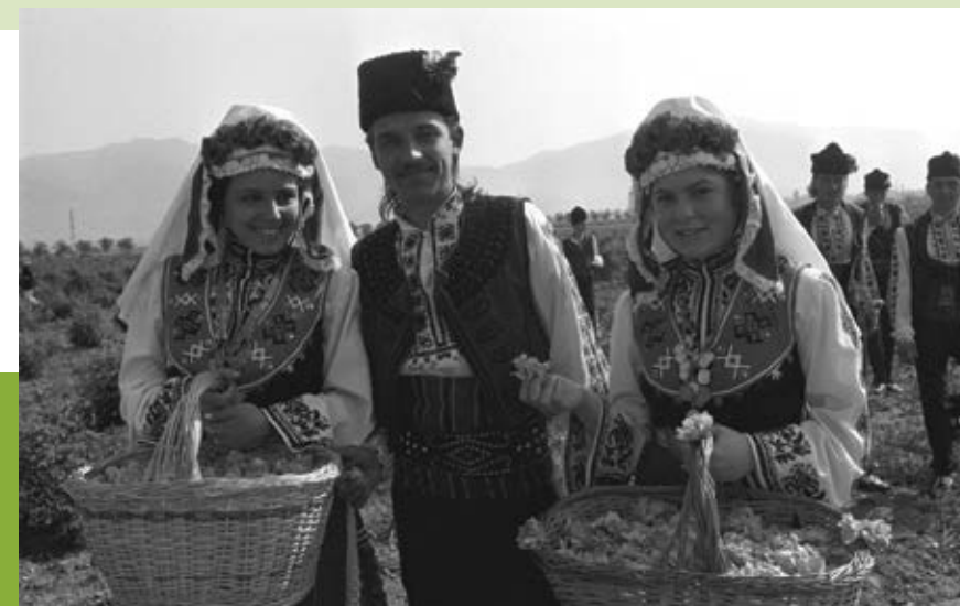
3 юни 1991 г. Празник „Казанлъшка роза 91“. Кадр от традиционния ритуал по започване на розобера в града

В центъра на града се състои манифестация на розопроизводителите от Старозагорски и Пловдивски окръг. Отличие за първенец в розопр-