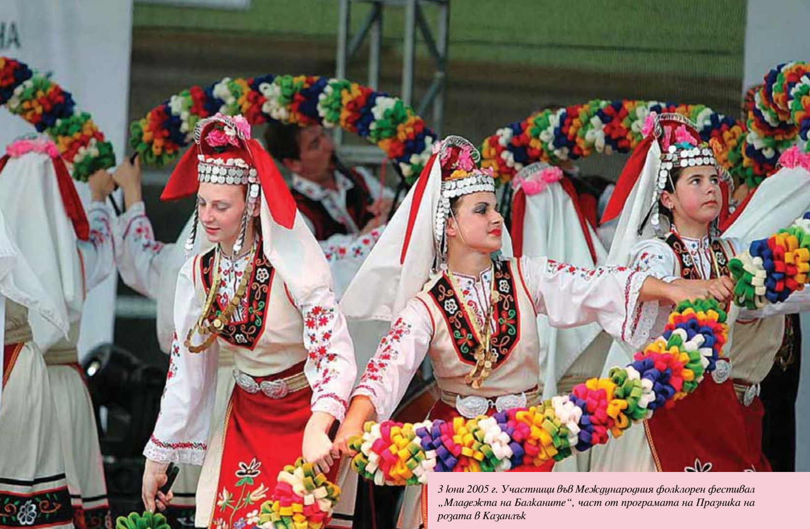
3 юни 2005 г. Участници във Международния фолклорен фестивал „Младежта на Балканите“, част от програмата на Празника на розата в Казанлък

териите. Спектакълът ще бъде предложен на гостите на предстоящия Празник на розата. Той ще се играе цяло лято пред чужди и български туристи.