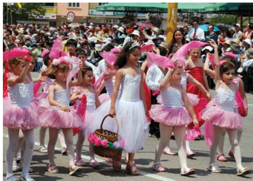
Казанлък, 3 юни 2007 г. Деца от детска градина „Слънчище” също се включват в празника

Казанлък не е просто географски център на страната, а истински кръстопът на цивилизациите и културата. Това заявява президентът Георги Първанов пред няколко хиляди казанлъчани и гости на града преди началото на празничното шествие на 4 юни, което предшества финала на Празника на розата. Президентът посочва, че тук – в Казанлъшкото поле, известно с тракийските находки, е фундаментът на европейската култура и припомня, че археологичните сензации от последните две-три години са предизвикали огромен интерес от Рим до Копенхаген.