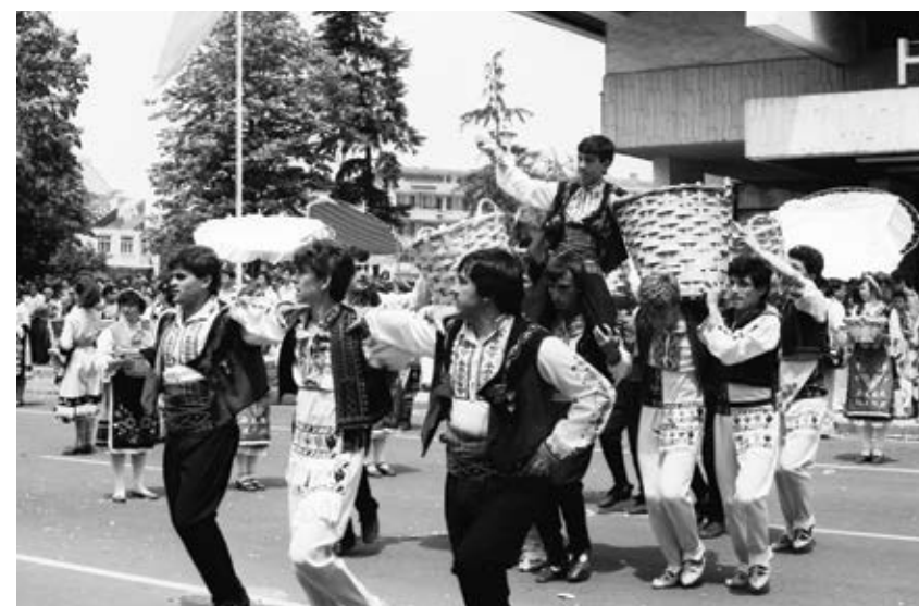
Казанлък, 6 юни 1986 г. С много песни и танци жителите и гостите на града отбелязват началото на розобера

На полето сред зеленината и уханието на рози се състои и голям събор, посветен на първия национален Празник на розите.