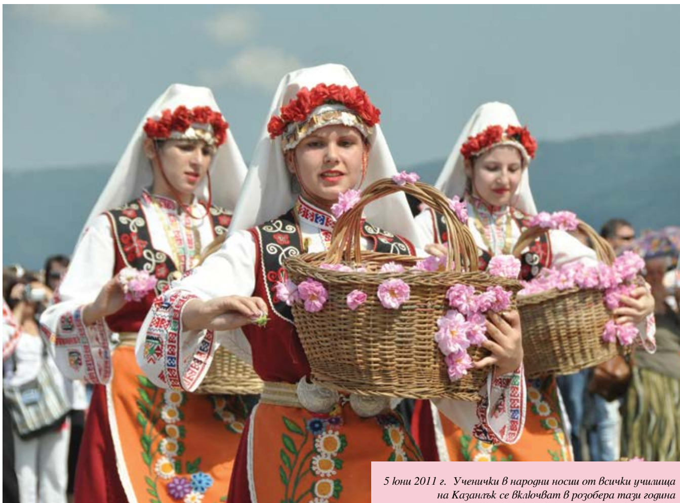
5 юни 2011 г. Ученички в народни носии от всички училища на Казанлък се включват в розобера тази година