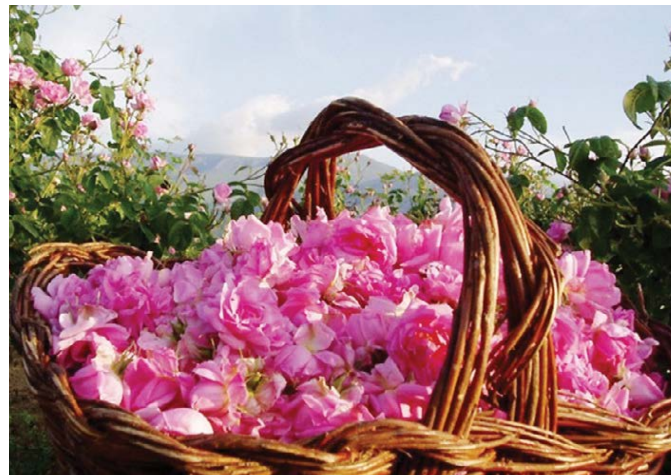
Материалите в хронологията са събрани със съдействието на Ренета Георгиева - стажант в „Исторически архив“ на БТА

Той отбелязва, че 120-ото издание на най-емблематичния фестивал на България ще се състои между 1 и 4 юни следващата година. Вълчев посочва, че участниците в медийната среща имат специална покана от кмета на Казанлък заедно да отбележат юбилейния Празник на розата и там да поговорят за медиите и празниците.