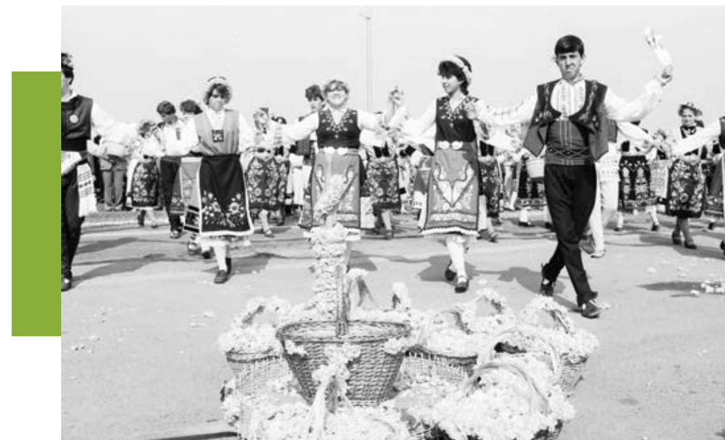
1 юни 1986 г. Празник на розата в Казанлък

Наред с производството на розово масло през тази година в три специализирани розоварни фабрики ще бъдат добити и значителни количества розов конкрет. С това нашата страна ще задоволи нарасалото търсене както на този продукт, така и на получаваното от него розово абсолю,