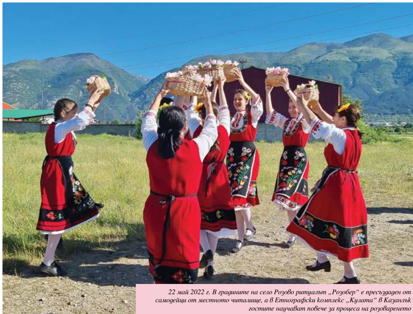
22 май 2022 г. В градините на село Розово ритуалът „Розобер“ е пресъздаден от самодейци от местното читалище, а в Етнографски комплекс „Кулата“ в Казанлък гостите научават повече за процеса на розоваренето