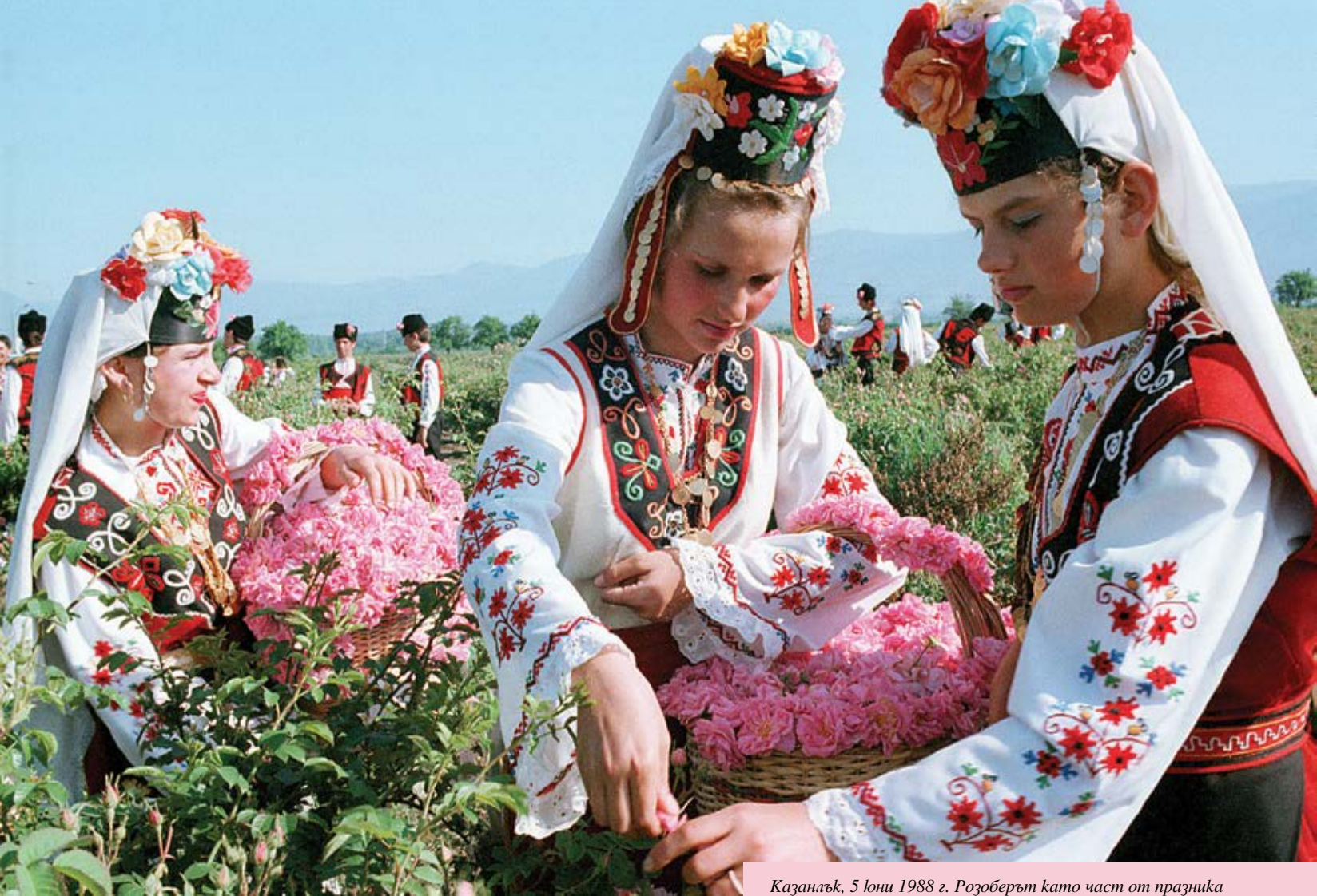
Казанлък, 5 юни 1988 г. Розоберът като част от празника

изграждат ваканционни селища в Казанлък и в града си, а френският парфюмериен гигант е пожелал да пренастрои рецептите си за използване на българско розово масло, понеже в последните 15 години „Шанел“ използвал суровината от южната ни съседка.