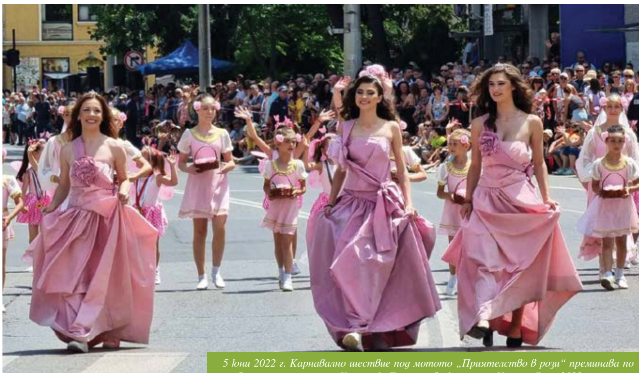
5 юни 2022 г. Карнавално шествие под мотото „Приятелство в рози“ преминава по главната улица на град Казанлък. То е предвождано от Царица Роза 2022 и нейните подгласнички и събра като публика стотици жители и гости на града