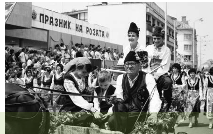
2 юни 1986 г. Ежегодният Празник на розата се провежда в Казанлък

Населението от китното подбалканско село, взело името и създадо Празника на българската маслодайна роза, изразява отново заедно с многобройните си гости от цялата страна своята обич към Царицата на пролетта. На пътя, край селския площад, девойки в пъстри носии, с кошници розов цвят и с венци от рози посрещат гостите и ги закичват за здраве. По стар обичай те им поднасят и шарени бълкици.