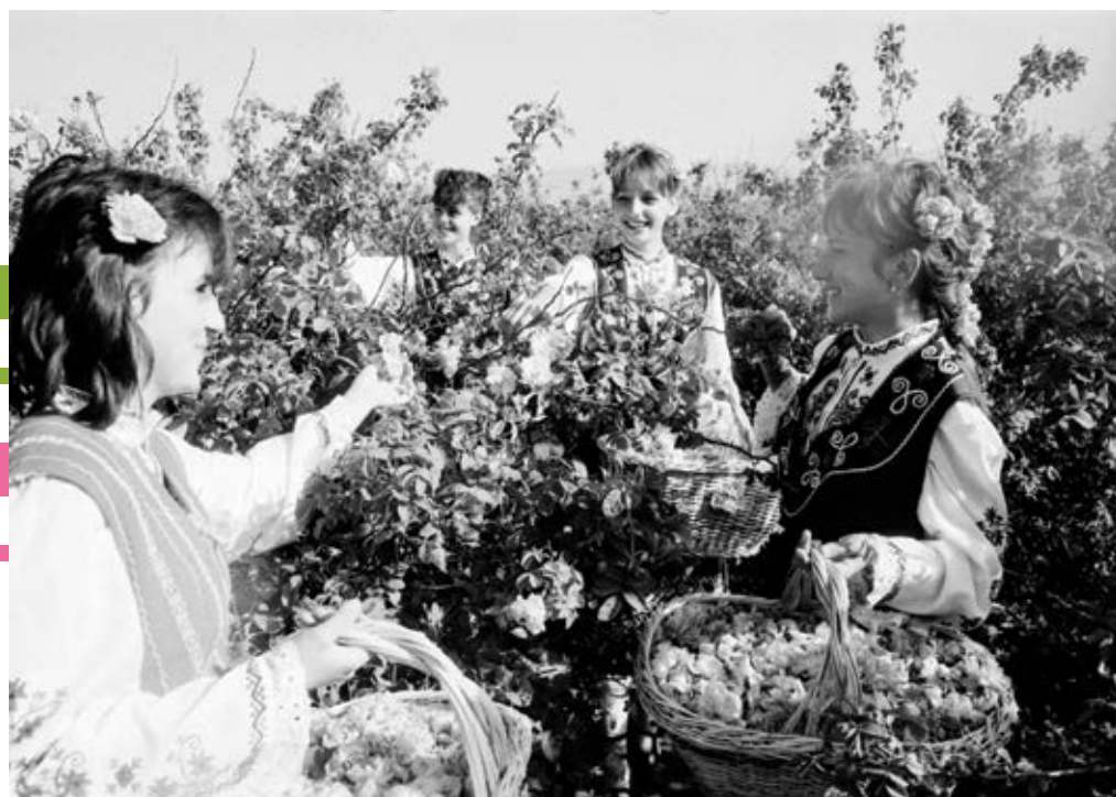
Казанлък, 5 юни 1989 г.

Празникът на розата в Казанлък тази година се състои на 6 юни. „Той бе възторжена прослава на труда на създателите на едно богатство, раз-