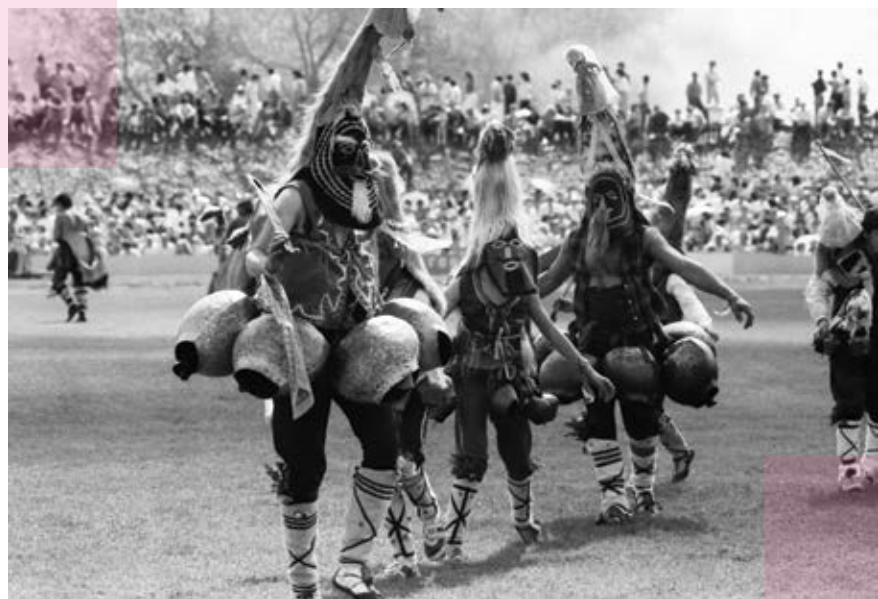
Казанлък, 12 юни 1989 г.

Накрая ще бъде уредена изложба на произведения, създадени от участниците в пленера, част от които ще останат притежание на художествената галерия на домакините.