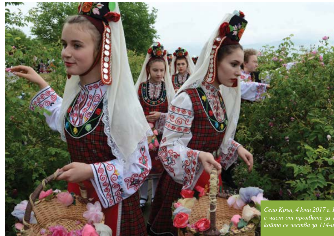
Село Крън, 4 юни 2017 г. Ритуалът „Розобер“ е част от проявите за Празника на розата, който се чества за 114-и път

Сцената е изградена от дърво и камък и се намира на метри от уникалната Казанлъшка тракийска гробница. Много светлинни и музикални ефекти ще съпътстват танците, а текст на 5 езика ще разяснява на гостите историята на мис-