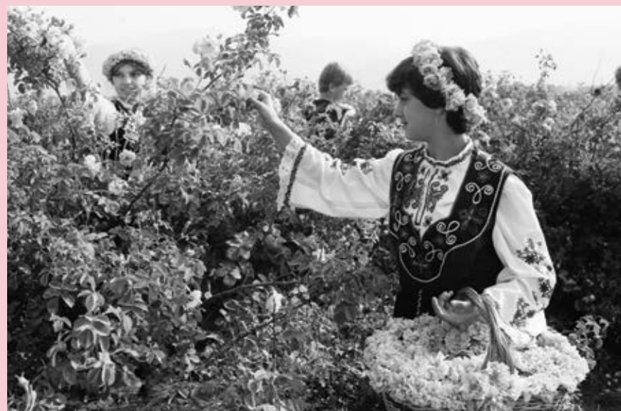
1 юли 1986 г. Моменти от Празника на розата в Казанлък