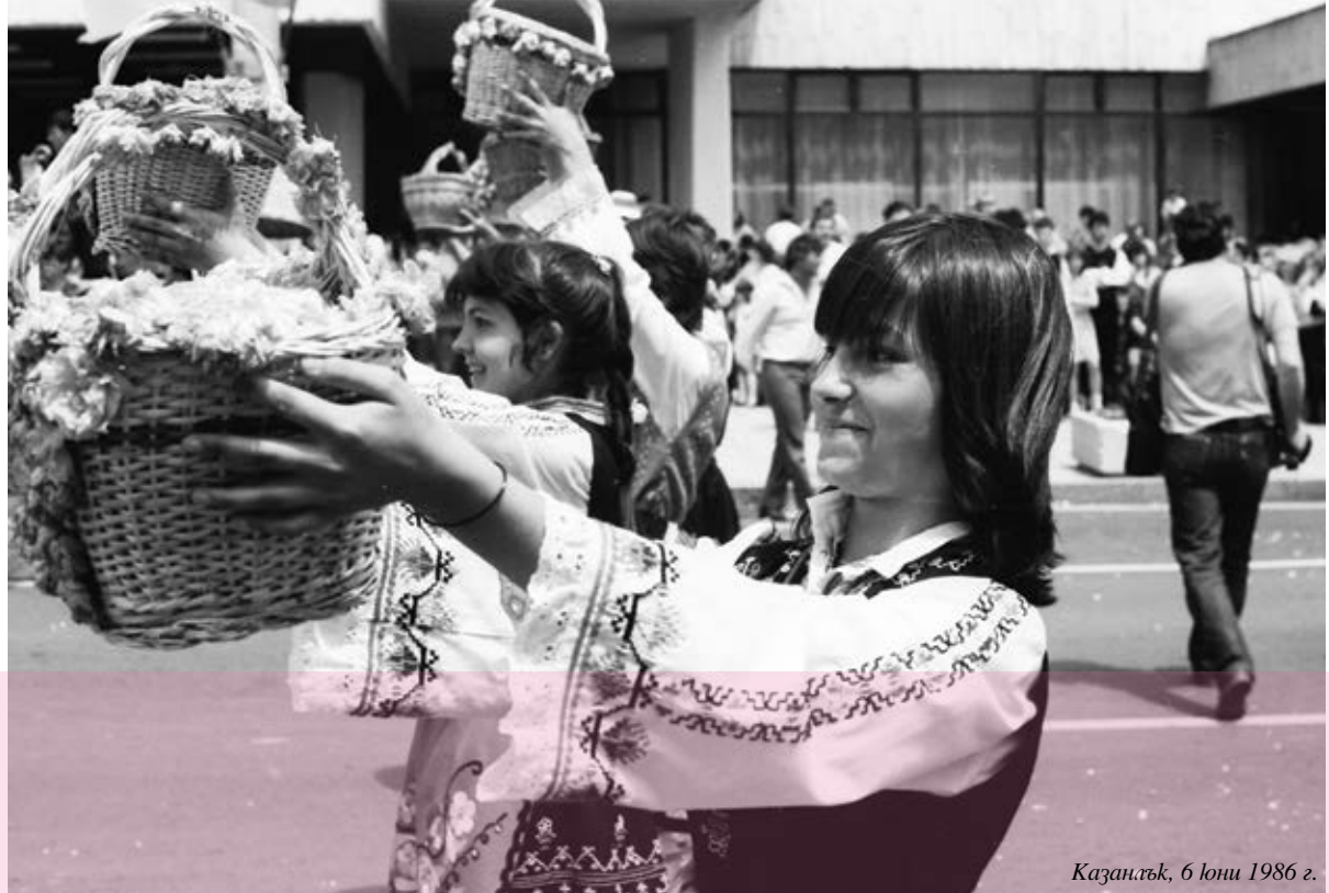
Казанлък, 6 юни 1986 г.