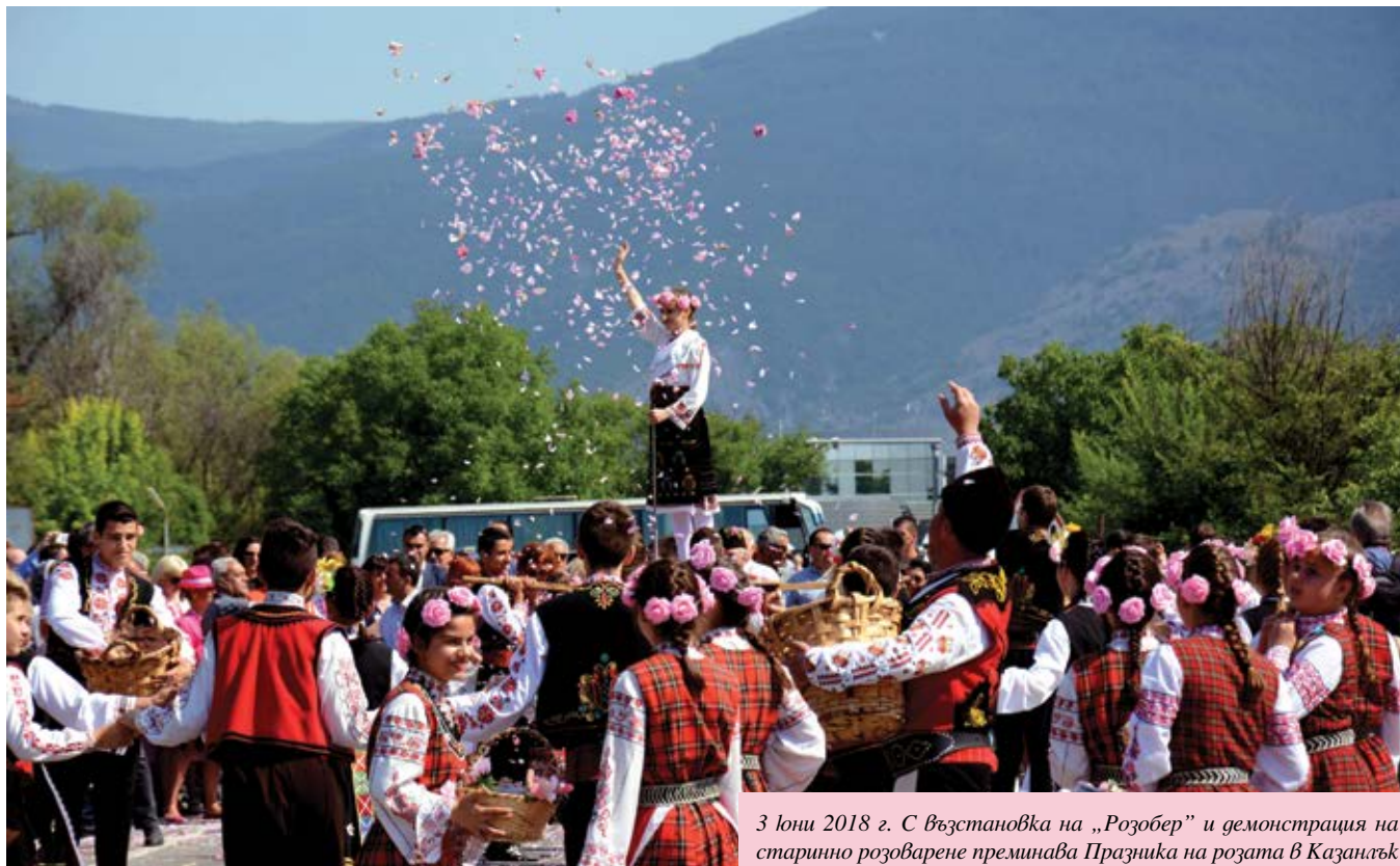
3 юни 2018 г. С възстановка на „Розобер“ и демонстрация на старинно розоварене преминава Празника на розата в Казанлък

ния градски булевард „23-ти Пехотен шипченски полк“. Преди това ще бъдат традиционните ритуали „Розобер“ и „Розоварене“ в казанлъшките глолови градини.