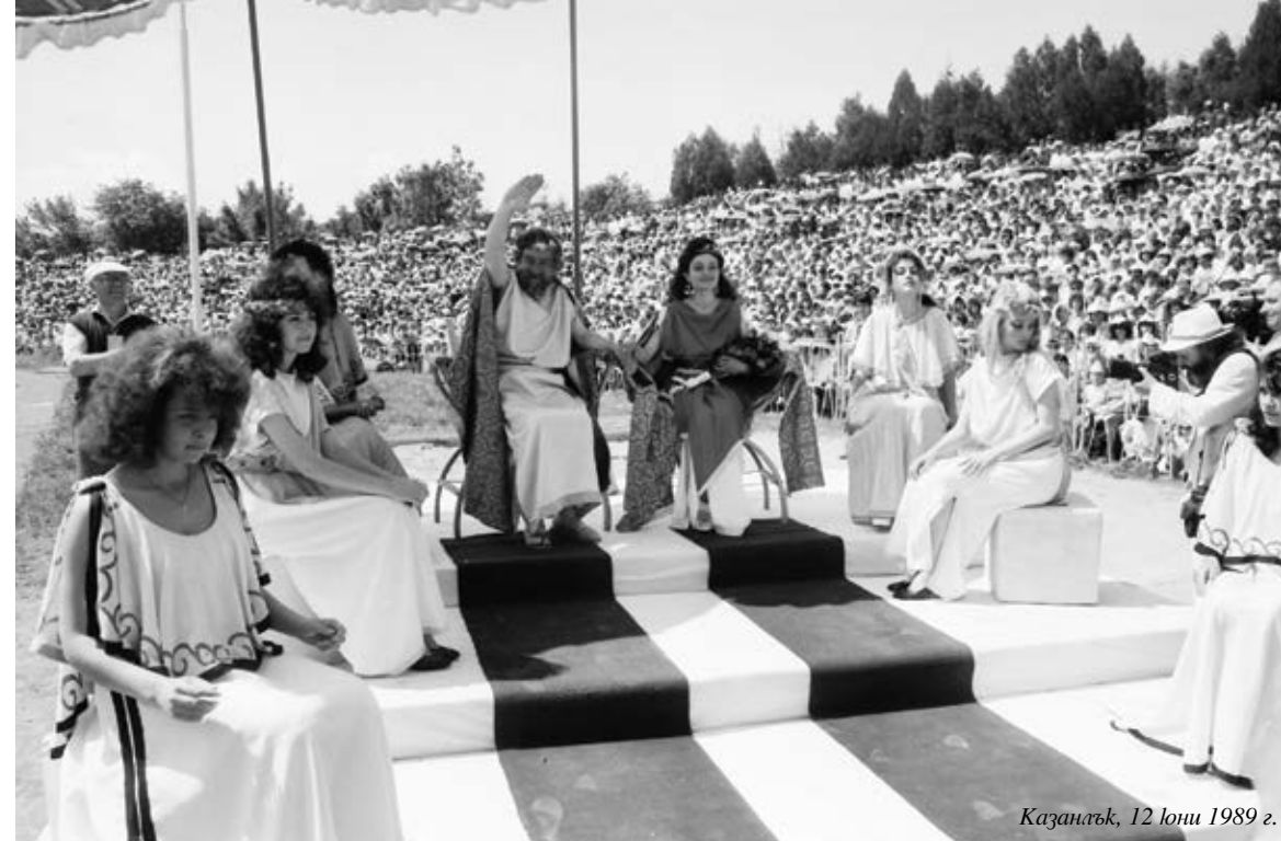
Казанлък, 12 юни 1989 г.

На една от импровизираните сцени в увеселителния парк край града е районният събор на народното творчество „В Долината на розите“. В градската художествена галерия е уредена изложба от неизвестни творби на Дечко Узунов, а хор