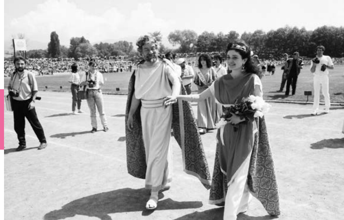
Казанлък, 12 юни 1989 г.

несло славата на отечеството по света“, пише в новината на БТА от деня.