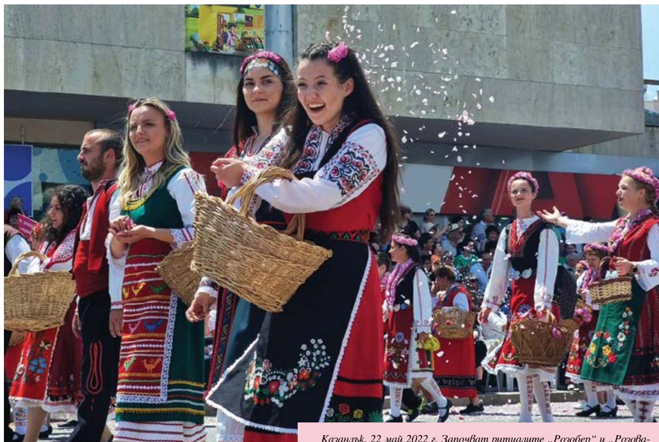
Казанлък, 22 май 2022 г. Започват ритуалите „Розобер” и „Розоварене” в региона на Казанлък. Събитията са част от програмата на традиционния за града Фестивал на розата

Официалното откриване на 43-тия Празник на розата е на 30 май от 20,30 часа на градския площад „Севтополис” с фойерверк шоу. Традиционното празнично карнавално шествие е от 12,00 часа на следващия ден. То ще премине по централ-